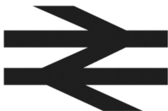
fig 1 –British Rail (1964) Design Research Unit / Gerry Barney, uma das marcas favoritas dos leitores da Creative Review, segundo sondagem feita em 2011.

ferramenta pedagógica . literacia visual . sintaxe . processo . síntese