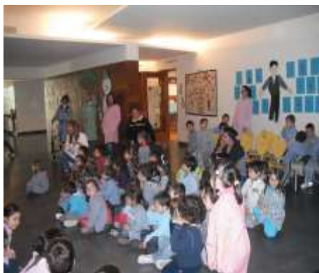
Figura 13 – Comunidade Educativa do Pré-Escolar

Após uma breve contextualização sobre as diferentes atividades que foram desenvolvidas no âmbito da Área de Expressão e Comunicação, e partindo do pressuposto focado inicialmente sobre a integralidade das abordagens às diferentes áreas de conteúdo, no eixo desta esfera de exploração, importa ainda analisar a atividade que foi desenvolvida no quadro da Expressão Dramática, consistindo na dramatização de uma história que integra o espaço de “Leitura” da sala de atividades, intitulada por “Vamos Espreitar...A Quinta” (da Porto Editora com ilustrações de David Crossley, 2003). Esta necessidade de realizar uma atividade lúdico-pedagógica que fomentasse a comunicação nas suas diversas ascensões, surgiu do interesse do grupo de crianças, após um diálogo sobre animais, com vontade para reproduzir os sons dos mesmos, interpretando as características que os distinguem uns dos outros (Figura 12 – Dramatização).