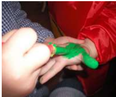
Figura 7 – Pintura da Mão do Colega

A intencionalidade educativa parte para a exploração sensorial, (re)conhecendo a funcionalidade dos seus sentidos, e da pertinência dos mesmos para desenvolver competências e despertar o desejo de ir mais além do que sabe ou julga saber (cf. Anexos do Tipo B5.2).