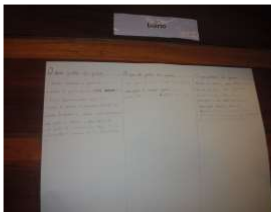
Figura 14 – “Diário” Semanal

A área de Expressão e Comunicação, revelou-se transversal a todas as atividades desenvolvidas no âmbito da intervenção educativa, contudo os focos de exploração incidiam de acordo com as planificações realizadas em tríade (Díade de Estagiárias e Educadora Cooperante) semanalmente, partindo essencialmente da reflexão rotineira em grande grupo, que acontecia todas as sextas-feiras, com o intuito de realizar a sistematização da