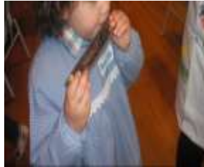
Figura 9 - Harmónica