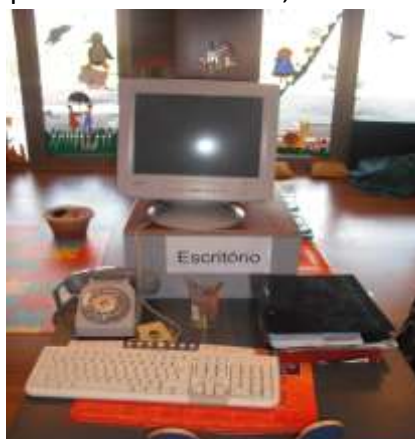
Figura 2- Escritório

Contudo, e tendo em conta uma perspectiva construtivista, a diáde de estagiárias, após o contacto com diferentes expressões do grupo de crianças, sentiu necessidade de criar um novo espaço dentro da sala de atividades para realizar tarefas de correspondência e organização documental. Importa aqui salientar o facto de este novo espaço se intitular por “Escritório” (sugestão de um conjunto de crianças e aceitação por parte das restantes), pois segundo expressões lineares, este espaço possibilitaria “resolver assuntos sérios, tal como os adultos fazem” (Criança J) (Figura 2).