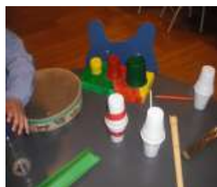
Figura 5 – “Instrumentos Musicais”

A construção destes materiais, e tal como foi referido em momentos de reflexão em tríade (diálogos orais bem como narrativas colaborativas, cf. Anexo A3 – Narrativas Colaborativas), permitiu transportar as crianças para um mundo novo, que de certa forma contactavam inconscientemente mas, neste contexto estratégico de exploração, foi exequível complexificar as relações não apenas com os objetos mas também com os seus pares e