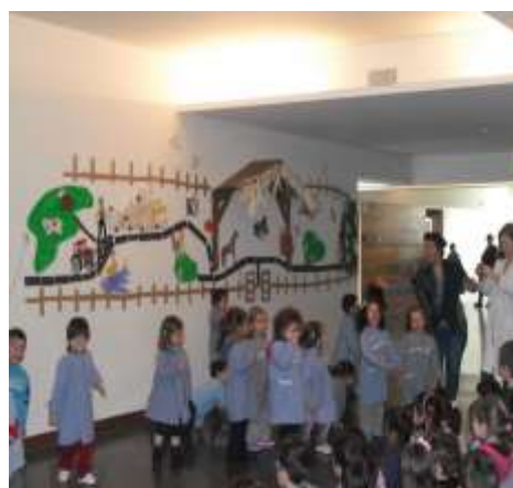
Figura 12 - Dramatização

Tendo em conta o que foi descrito anteriormente, importa refletir sobre as potencialidades da Expressão Motora, bem como de todas as outras expressões, na medida em que permitem o contacto com o corpo, tomando consciência que este “constitui o instrumento de relação com o mundo e o fundamento de todo o processo de desenvolvimento e aprendizagem” (ME, 1997:58).