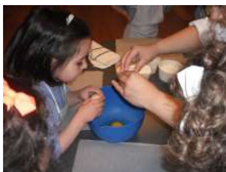
Figura 15 – Confeção das Bolachas

Perante o exposto, eis que foi desenvolvida uma atividade de confeção de bolachas (Figura 15), remetendo a criança para questões de higiene, antes de manusear os alimentos, bem como no decorrer da confeção em si. O grupo interveio de forma ativa em todo o processo, contudo anteriormente à produção, foi dado ênfase a um momento prévio em que foram apresentadas