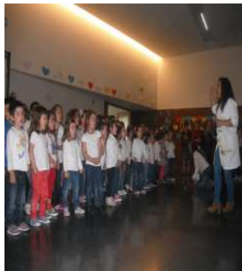
Figura 18 – Festa Da Família

Neste sentido, as práticas que foram desenvolvidas no decorrer da intervenção da díade de estagiárias, perspetivou-se segundo uma constante