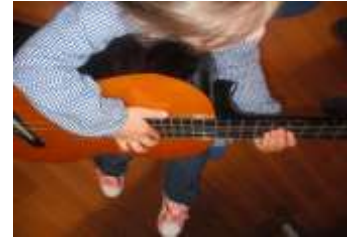
Figura 10 - Guitarra

Importa acrescentar que a realização das atividades de exploração dos sons, promoveram ainda a articulação com uma UC que integra igualmente o plano de estudos do Mestrado em Educação Pré-Escolar e Ensino do 1º Ciclo do Ensino Básico, remetendo desta forma para a formulação de objetivos de desenvolvimento que vão ao encontro de uma perspetiva construtivista, na medida em que as aprendizagens surgem dos conhecimentos prévios evidenciados no diálogo constante com o grupo de crianças, encontrando validade técnica nos mesmos e (re)construindo um discurso fundamentado e coerente em articulação com os pressupostos que regem e regulam não apenas a atividade docente mas também o meio físico.