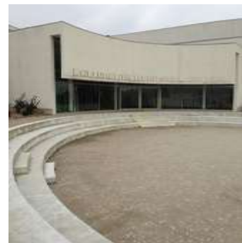
Figura 1: Escola Básica Professor Doutor Marques dos Santos

A Escola Básica Professor Doutor Marques dos Santos (Escola dos Sentidos) situa-se na freguesia de Oliveira do Douro, no concelho de Vila Nova de Gaia, instituição que se encontra agregada ao Agrupamento de Escolas António Sérgio. É pertinente realizar uma breve contextualização do espaço, na medida em que o mesmo constitui um fator que concorre para o desenvolvimento do processo educativo. A figura 1, revela a modernidade que subjaz às instalações da instituição, contribuindo para a reestruturação da zona envolvente, enquanto promotor de desenvolvimento.