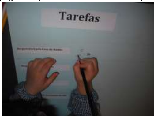
Figura 19 – “Quadro de Tarefas”

A análise retrospectiva sobre o processo de intervenção em contexto educativo que foi desenvolvida, tem vindo a seguir um encadeamento lógico, na medida em que se focam as diferentes áreas de conteúdo exploradas, descrevendo e refletindo simultaneamente sobre a pertinência das mesmas. Contudo, importa ainda, direcionar agora o nosso olhar para dois dos recursos que permitem o registo de informação por parte das crianças e que tem vindo a ser alvo de indagações pelas crianças mas também pelos profissionais e futuros profissionais, descodificando continuamente estratégias diversificadas de usufruir dos mesmos. Esta referência diz respeito ao “Quadro de Tarefas” (Figura 19) e ao “Quadro de Presenças” (Figura 20).