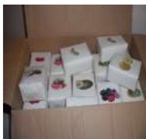
Figura 4- “Jogo Da Memória”