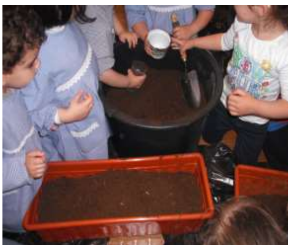
Figura 16 – Manipulação da Terra

posterior interferência nas diferentes fases da confeção.