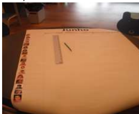
Figura 20 – “Quadro de Presenças”