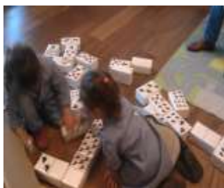
Figura 3 – “Dominó da Quinta”

Indo ao encontro ainda dos materiais/recursos disponíveis na sala de atividades, a díade de estagiárias foi tomando consciência que as crianças evidenciavam necessidades de exploração/manipulação de materiais diversificados, dada a escassez de materiais não-estruturados. Foi então, que surgiu a intencionalidade pro-ativa das estagiárias, quando em conversa com o grupo, questionaram-no sobre possíveis materiais/instrumentos que gostariam de ter para manipularem no dia a dia da sala de atividades. De uma forma geral registaram-se interesses ao nível do jogo simbólico, bem como de materiais que lhes permitissem contactar e conhecer com o mundo que os rodeia. Nesse sentido, surgiu a construção de diversos materiais pedagógicos, nomeadamente o “Dominó da Quinta” (Figura 3), o “Jogo da Memória” (Figura 4) e “Instrumentos Musicais” (Figura 5).