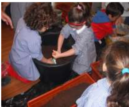
Figura 17 - Plantação

Assim sendo, as crianças foram convidadas a realizar plantações de morangueiros, salsa e alface, após deliberação por parte do grupo, com o intuito de desenvolver questões relacionadas com o ciclo natural da vida de