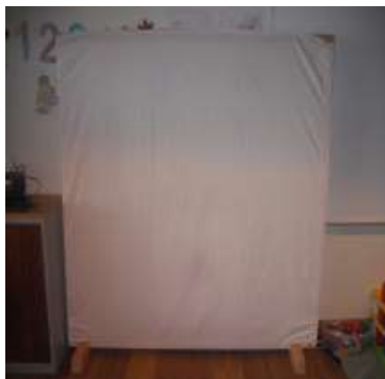
Figura 11 – Tela de Sombras Chinesas

Ainda no âmbito da Exploração Sonora, surge a construção de uma tela de sombras chinesas por parte das estagiárias, com o intuito de proporcionar à criança a diversificação de recursos que permitam o apelo ao imaginário e à magia, tão propícia neste período de crescimento das crianças. Esta construção parte da iniciativa da díade de estagiárias, revelando posteriormente ao grupo que é um “presente” que passará a integrar a sala de atividades, sendo usufruída sempre que possível e de acordo com as suas necessidades e interesses (Figura 11).