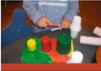
Figura 8- Tambor

através dos órgãos dos sentidos, na medida em que percecionam utilizando estratégias diversificadas, tal como é visível nas Figuras 8, 9 e 10.