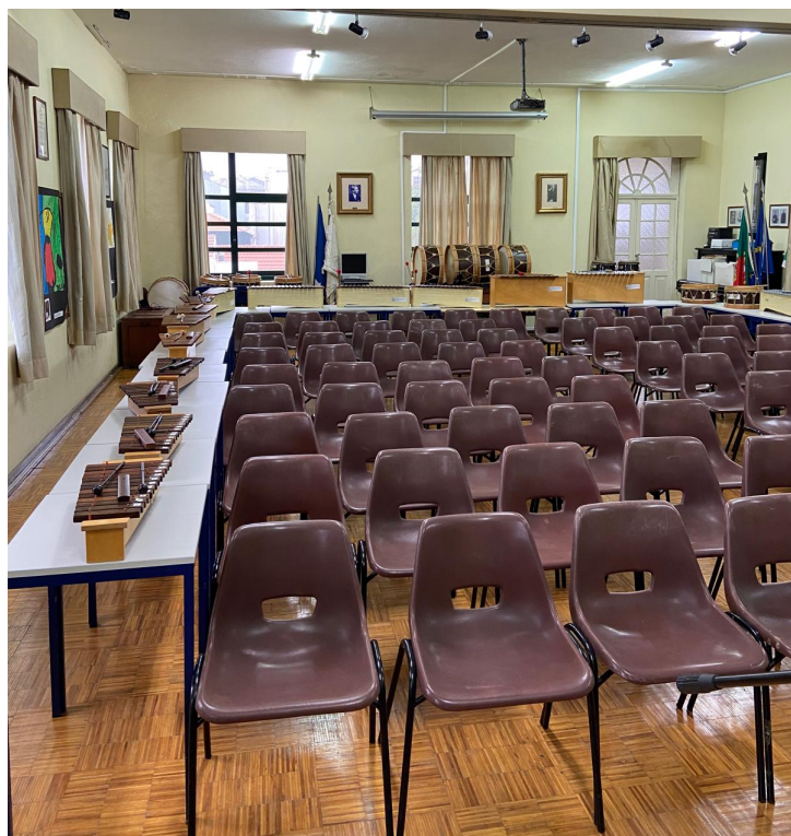
Figura 2 Sala Museu organizada para concerto

A sala 13 onde se realizam a maioria das aulas conta com 18 mesas, sendo que 14 delas se destinam a organizar a turma, e as restantes de apoio ao professor. A turma organiza-se pelas mesas que estão na disposição tradicional, dividida por filas. A sala dispõe de quadro pautado, tela para projeção e projetor, piano digital, sistema de som fixo e portátil, bem como armários onde são guardados alguns instrumentos.