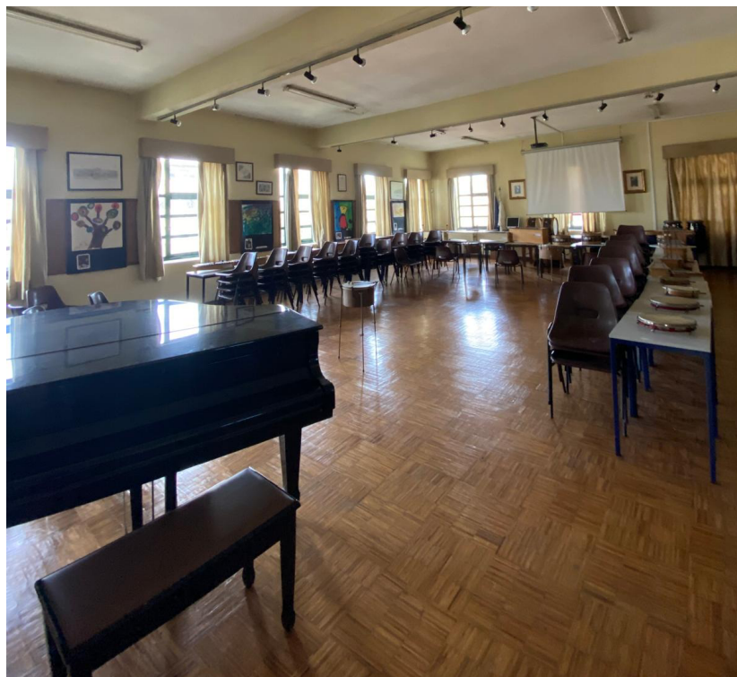
Figura 1 Sala Museu organizada para a aula

Apesar das instalações um pouco envelhecidas, no que toca às aulas de Educação Musical a escola conta com boas instalações, contando com três salas para o efeito. No decorrer da Prática de Ensino Supervisionada (PES) as aulas decorreram na sala 13 e na Sala Museu (figura 1 e 2).