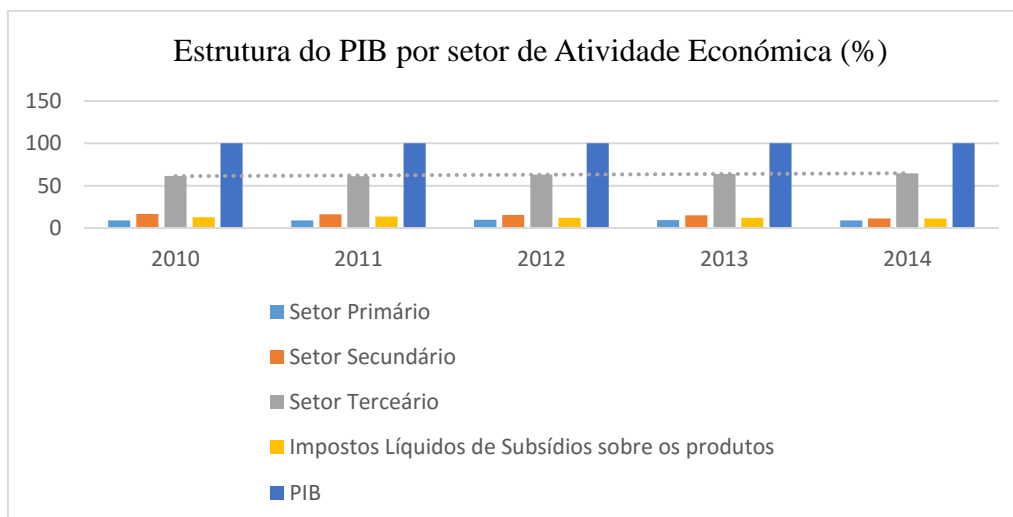
Figura 2: Estrutura do PIB por setor de atividade económica (2010 a 2014)

No período de 2010 até 2015, Cabo Verde apresentou taxas de crescimento do PIB positivas, tendo sido em 2015 o ano em que o crescimento (ainda que positivo) foi inferior. Para a determinação do PIB de Cabo Verde muito contribui o facto de este ser um país como uma economia muito terceirizada. Conforme se observa na figura 2, o setor dos serviços é o que apresenta uma maior percentagem sobre o PIB do país, registando em 2014 64,7% do PIB.