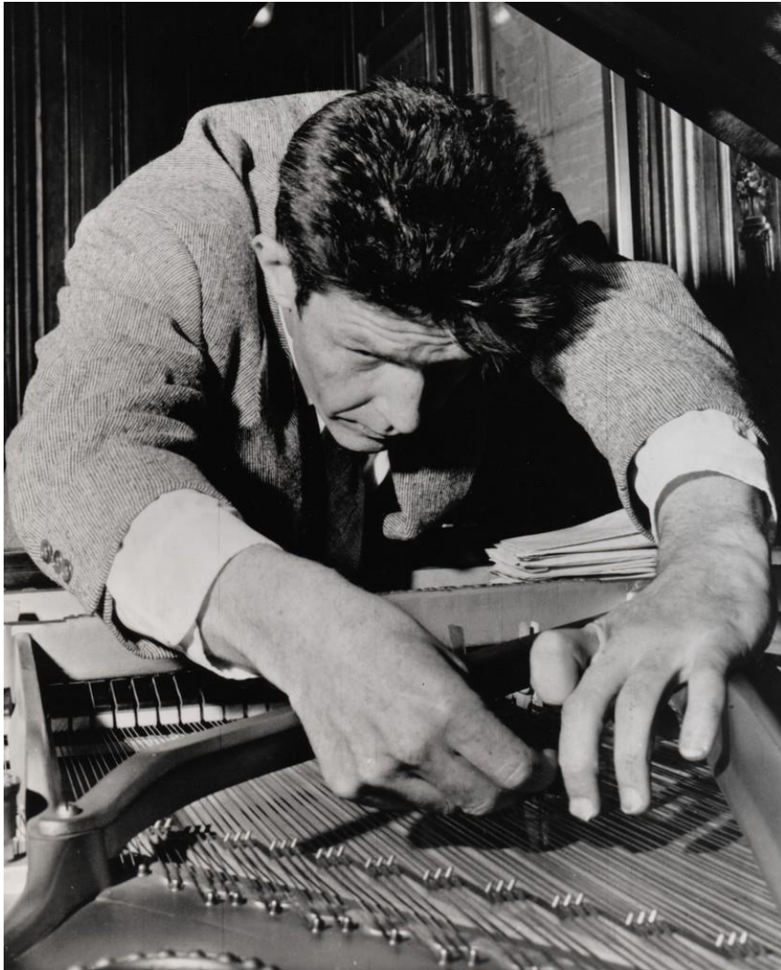
JOHN CAGE (1912-1992)