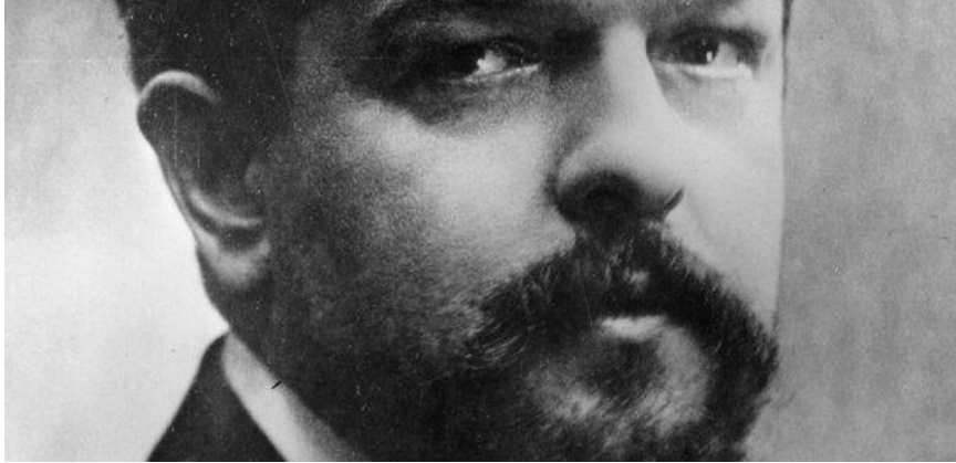
CLAUDE DEBUSSY (1862-1918)