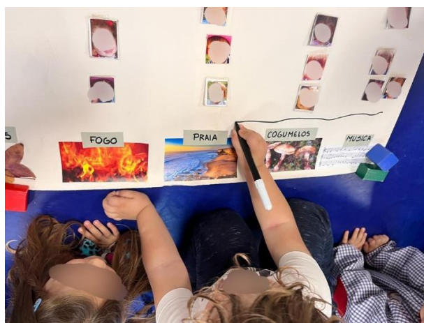
Figura 6 - Elaboração do Histograma

Ao analisar as notas de campo acima, repara-se que as crianças desenvolveram competências no âmbito da área de Formação Pessoal e Social e no domínio da Matemática, inserido na área de Expressão e Comunicação. Com a concretização do histograma, as crianças demonstraram consciencialização democrática, considerando o respeito pelo outro e pelas suas decisões e gostos e desenvolverem o sentido de pertença. Para além disso, este recurso exige, simultaneamente, o desenvolvimento de capacidades no que diz respeito à construção e leitura de gráficos, de forma que as crianças sejam capazes de ver a matemática como um elemento natural do seu quotidiano e de resolução de problemas. Assim, o grupo teve a possibilidade de desenvolver o raciocínio matemático, como é o caso na contagem dos elementos de cada grupo e desenvolveram conhecimentos na organização e tratamentos de dados (Silva et al., 2016).