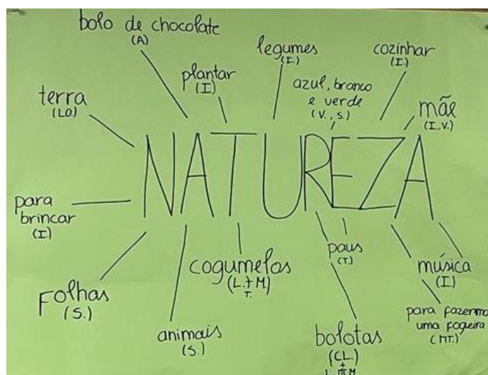
Figura 5 - Mapa concetual "A Natureza"

Algumas crianças mostraram-se bastante curiosas ao ver os adultos escrever na cartolina, questionando “O que estas a fazer?” (MF.). A educadora estagiária explicou que