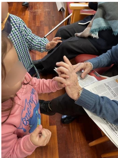
Figura 7 - LO. agradece aos idosos

confiança na presença dos utentes tentaram realizar as suas questões e a educadora-estagiária serviu como interprete, repetindo as perguntas colocadas pelas crianças e apontando as respostas dos idosos em papel (Apêndice A2.1). Desta forma, “pessoas da comunidade contribuíram como recursos do processo de aprendizagem” (Lopes da Silva, 1998, p. 97).