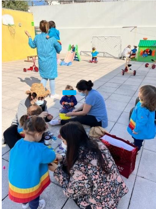
Figura 4 - Crianças e pais colaboram na construção de espanta-espíritos

Posto isto, leva-nos à próxima estratégia utilizada para a construção de um clima de confiança com os pais: o momento de acolhimento (Post & Hohmann, 2011). A mestranda procurou receber as crianças no momento de acolhimento, interagindo com os pais para promover a partilha de informação sobre as crianças, de modo a responder às necessidades e temperamento de cada criança, facilitar a transição de casa para a creche e favorecer o bem-estar das crianças. Como resultado, ao presenciar a relação estabelecida entre os pais e a educadora-estagiária, as crianças puderam compreender que existia uma relação saudável entre ambos os adultos, traduzindo-se no seu bem-estar e autoconfiança. As seguintes notas de campo refletem algumas conversas que existiram com os pais, nos momentos de chegada e acolhimento das crianças, durante a PES em creche: