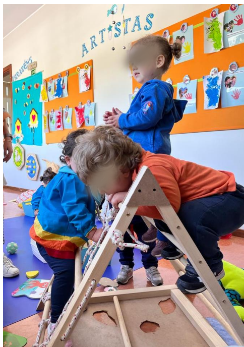
Figura 3 - Crianças exploram o triângulo de diferentes formas

Após analisar as explorações de algumas crianças (Apêndice A1.1), podemos constatar que o material possibilitou a exploração de diferentes capacidades motoras, como subir, descer, apoiar e, ainda, permitiu a construção de alguns conceitos como alto/baixo, dentro/fora, subir/descer. Assim, o triângulo de Pikler permitiu estimular indiretamente a criança, fomentando o seu desenvolvimento motor autônomo.