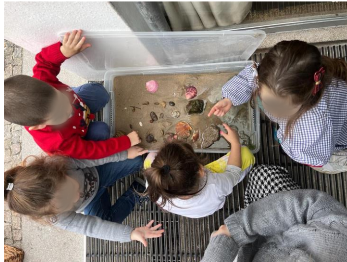
Figura 8 - Construção da maquete da praia

educadora-estagiária forneceu uma caixa grande transparente, areia, conchas, pedras de vários tamanhos e algas (Apêndice A2.1). Todos os elementos do grupo demonstraram um alto nível de envolvimento durante o processo de construção da maquete, revelando alguns indicadores como: concentração não interrompida, absorção pela atividade, muito motivada, apelo forte, atenção aos detalhes, ganha experiências novas e de natureza profunda e aprecia estar totalmente envolvida (Laevers et al., 2005). A maquete da praia foi colocada na área da natureza, para que todas as crianças a pudessem explorar.