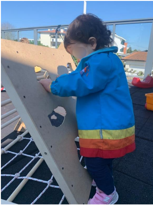
Figura 1 - N. explora uma das faces do triângulo