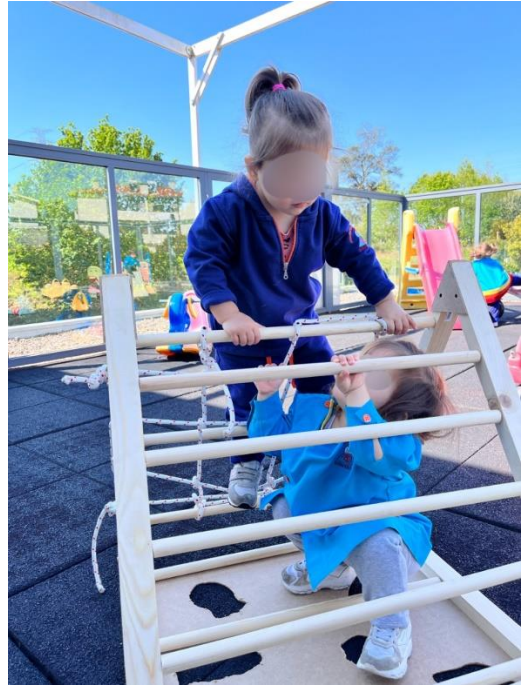
Figura 2 - A.C e E. exploram o triângulo de diferentes perspectivas

Ao refletir após a ação (Schön, 2000), o par pedagógico concluiu que, apesar de inicialmente ter acreditado que introduzir um novo material no espaço elegido não teria sido a melhor estratégia, depois de observar as crianças aos poucos a demonstrarem curiosidade e a autonomamente explorarem o novo material, compreendemos que afinal foi uma escolha feliz. Contudo, a opção de realizar a exploração em pequenos grupos demonstrou-se realmente não ter sido a mais indicada, tendo resultado melhor em grande grupo. Contudo, as planificações são flexíveis e a dupla pedagógica retificou a organização estipulada resultando num momento de exploração autónoma e de liberdade.