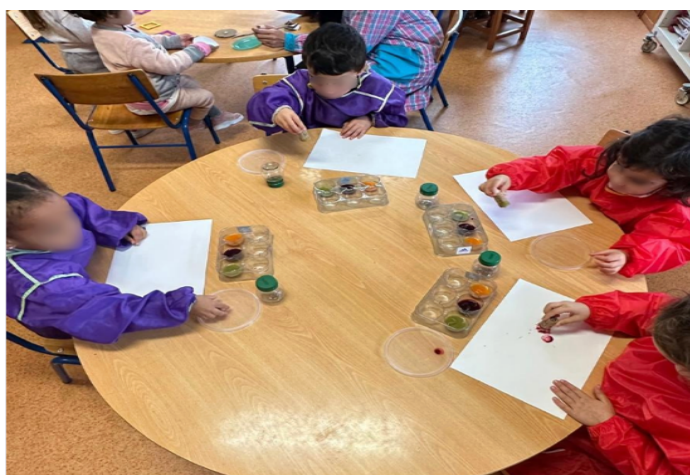
Figura 7: Organização dos materiais e do grupo

No desenvolvimento da ação, a mestranda esclareceu que as crianças poderiam provar a tinta, caso o desejassem. Foi notório o entusiasmo associado a essa possibilidade, sobretudo em algumas crianças. Uma delas mostrou-se particularmente motivada para experimentar e, assim que provou a tinta, comentou “Sabe a sopa, não gostei” (ver apêndice B14). De seguida, foi retomado que o gesto consistia em pousar e levantar o material, produzindo marcas, em vez de o esfregar. Algumas crianças apropriaram-se de imediato desta proposta, repetindo marcas e variando a pressão para observar efeitos diferentes, enquanto outras exploraram de forma mais livre, o que foi valorizado como expressão individual. Ao longo da atividade, a mestranda foi convidando as crianças a participar, procurando assegurar que todas tivessem oportunidade de