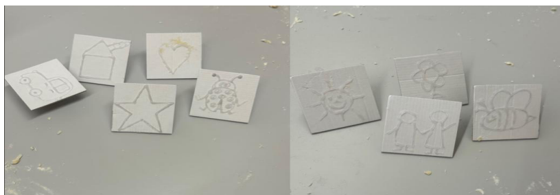
Figura 3: Carimbos utilizados na atividade

Num segundo momento, a mestranda disponibilizou diversos carimbos construídos de forma artesanal, que tinha criado para a área da expressão plástica. Estes carimbos foram elaborados com cartão e rolas de cortiça, tendo a mestranda utilizado cola quente para criar relevo sobre desenhos previamente traçados, o que permitiu tornar as formas visíveis quando impressas na pasta. Para facilitar o manuseamento, fixou meia rolha como pega e construiu um total de dez carimbos, distribuindo-os de modo que as crianças os pudessem partilhar e alternar durante a exploração. Para além dos carimbos, introduziu ainda instrumentos de modelagem, como o rolo e o cortador de massa, de modo a apoiar a exploração e a manter o envolvimento de cada criança na atividade. Os desenhos dos carimbos incluíam coração, estrela, casa, sol, duas crianças, carro, flor, joaninha, abelha e borboleta (ver Figura 3). Esta escolha procurou enriquecer a atividade com formas reconhecíveis e próximas dos interesses do grupo, nomeadamente os animais e as formas, mantendo a proposta aberta e permitindo que cada criança escolhesse, repetisse e combinasse marcas de acordo com o seu interesse.