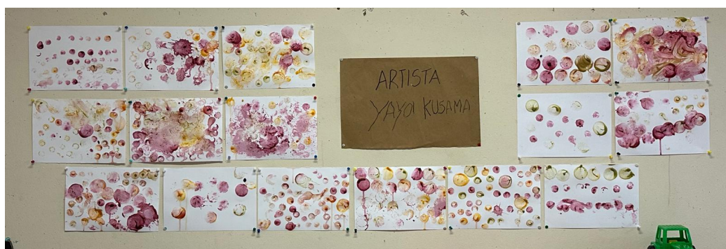
Figura 8: Apresentação dos quadros realizados pelas crianças

No final, a mestranda expôs as produções na parede da sala, tornando visível o trabalho realizado e reforçando o sentimento de pertença e a comunicação do processo vivido (ver figura 8). Quando os trabalhos já se encontravam secos, foi acrescentada uma legenda de identificação do quadro, construída com a participação das crianças, que escreveram o texto no computador, o recortaram e, posteriormente, o colaram junto da produção (ver apêndice B16).