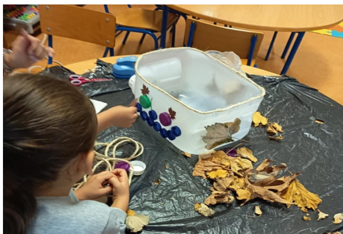
Figura 6: Cara sorridente criada pela B.P

Após concluída a decoração, as crianças deram início à sementeira, manipulando a terra e acompanhando as diferentes etapas do processo. Neste momento, participaram na colocação das sementes nos bidões correspondentes, repetindo-se o procedimento nos recipientes associados à Itália e à Irlanda (ver apêndice B4 e B6). Ao longo desta experiência, evidenciaram interesse e envolvimento, não apenas na manipulação da terra e das sementes, mas também no acompanhamento do processo, incluindo uma criança que decidiu tirar uma fotografia aos colegas enquanto colocavam água na terra (ver apêndice B5). No final, participaram ainda na identificação dos bidões, escrevendo o nome do que tinha sido semeado em cada bidão em garfos de madeira e colocando-os nos respetivos recipientes (ver apêndice B7). Deste modo, tornou-se visível o investimento das crianças ao longo de toda a proposta, tanto na decoração como no contacto com a terra e com as sementes, revelando que reconheciam esta experiência como significativa.