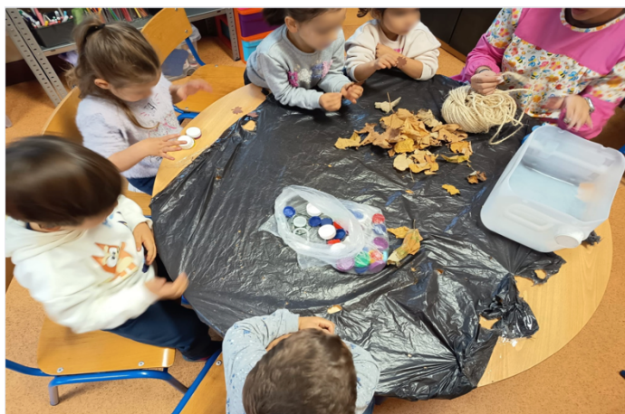
Figura 5: Distribuição e organização do material

Ao longo da atividade, foi possível observar o envolvimento das crianças. Por exemplo, uma criança referiu que “Com estas rolas podemos fazer uma cara a rir” (ver figura 6). Outra criança sugeriu a utilização da corda para fazer um fantasma e, ao observar essa criação, uma terceira criança pediu para tirar uma fotografia ao fantasma que a menina tinha feito (ver apêndice B2). Além disso, a mesma criança sugeriu ainda que a corda fosse colocada à volta do bidão (ver apêndice B3). Importa ainda referir que uma criança com NAS também participou na decoração dos bidões, indicando à mestranda onde pretendia que alguns materiais fossem colocados, o que evidenciou envolvimento na proposta e participação nas decisões do grupo. De forma mais ampla,