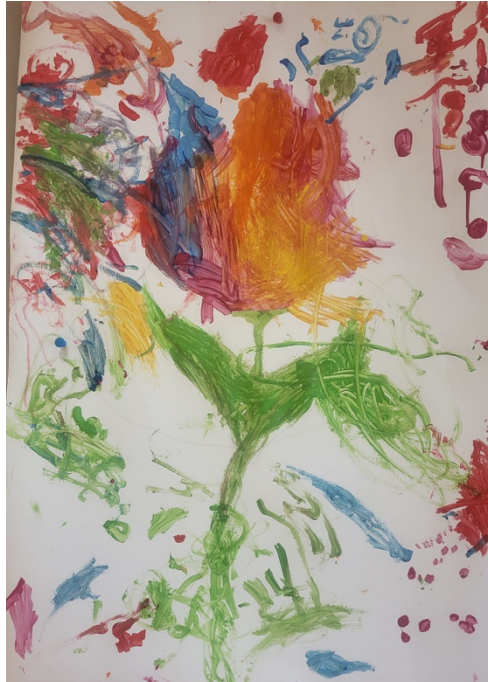
Figura 4: Resultado da Tulipa decorada pelas crianças

No que respeita ao bem-estar e ao envolvimento, a mestranda observou, de forma global, sinais de interesse, disponibilidade para participar, curiosidade perante os materiais e satisfação na exploração. Ao longo da atividade, tornaram-se visíveis indicadores de envolvimento como a concentração na ação, a persistência na repetição dos gestos, a energia colocada na aplicação da tinta, a atenção aos efeitos produzidos e a satisfação perante os resultados alcançados. A possibilidade de escolher cores, agir diretamente sobre o suporte e observar o resultado imediato das próprias decisões contribuiu para um maior investimento na atividade. A organização em pequenos grupos favoreceu igualmente a criação de um contexto mais tranquilo e ajustado, permitindo uma mediação mais próxima e sensível às necessidades de cada criança. Deste modo, observaram-se condições favoráveis ao bem-estar e ao envolvimento, em articulação com indicadores descritos na escala de Laevers (Laevers, et al., 2005) bem como com dimensões do empenhamento do adulto, nomeadamente a sensibilidade, a estimulação e a autonomia (Bertram & Pascal, 2009). No final, a mestranda optou por expor a tulipa no painel da entrada, de modo a tornar visível às famílias o processo de construção desenvolvido pelas crianças.