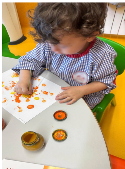
Figura 2: M.M a utilizar a tampa do frasco

Uma criança segurou a flor com cuidado e, tranquilamente, mergulhou-a na tinta e carimbou na folha, observando frequentemente a mestranda, como que à espera de validação. No caso de duas crianças, a mestranda observou que foram as únicas que, após utilizarem de imediato a tinta, interromperam a ação para observar a flor, chegando mesmo a tocar-lhe e a cheirá-la (ver apêndice A3). Nesse momento, uma criança comentou: “Isto é fofo”, apontando para as pétalas da flor, o que evidenciou atenção sensorial e linguagem associada à experiência. Esta alternância entre carimbar e explorar o objeto reforçou o carácter aberto da proposta e tornou visível a forma como cada criança construiu o seu próprio percurso de descoberta. Relativamente a outra criança, a mestranda observou que decidiu utilizar apenas duas cores e pediu ainda para usar a tampa do frasco da tinta, explicando depois à mestranda: “Rafa, aqui tem mais tinta, assim tenho mais tinta” (ver figura 2).