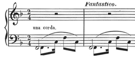
Fig. 1. Início de Tango Americano de Salon. 46