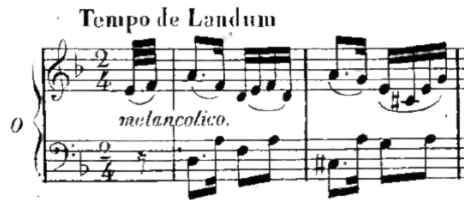
Fig. 2. Início de O Fado Rigoroso da Figueira. 47

Este ritmo é, nos sécs. XX e XXI na Argentina, reconhecido como o ritmo típico da Milonga. No fado aparecem desde cedo outros tipos de acompanhamento, por vezes mais ritmados, outros bastante constantes.