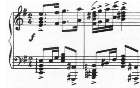
Fig. 5. Excerto de Como Reliquia Sagrada . 50

No género tango aparece, somente em exemplos depois de 1924, uma distribuição métrica menos sincopada (semelhante a uma marcha), tal como se verifica na conhecida La Cumparsita ou no exemplo menos exuberante da compositora Isolda Godard: