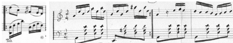
Fig. 3. Excertos de “Fado Ballada Militão”, de ca. 1846 e de “Fado” de Jesus Escoto. 48

Este ritmo é, nos sécs. XX e XXI na Argentina, reconhecido como o ritmo típico da Milonga. No fado aparecem desde cedo outros tipos de acompanhamento, por vezes mais ritmados, outros bastante constantes.