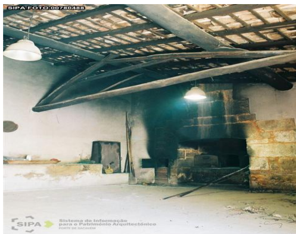
Figura 18 - Interior do Forno Comunitário de Idanha-a-Velha