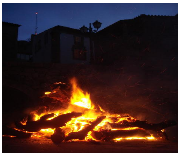
Figura 5 - Madeiro de Natal de 2008 na aldeia de Monsanto

Além do adufe, outro elemento distintivo do património cultural de Idanha-a-Nova é a marafona. As marafonas são bonecas tradicionais de Monsanto e Penha-Garcia, emblemáticas nas festividades locais, particularmente na Festa do Castelo ou da Divina Santa Cruz em Monsanto ( Revista Adufe , 2002, Nº.2 p.11). Estas bonecas, caracteristicamente sem rosto, são consideradas símbolos de fertilidade e proteção contra o mal. O seu fabrico e venda persistem como uma prática cultural importante, preservando assim uma tradição que integra crenças antigas com o artesanato contemporâneo da região (Evasões, 2020). Esta tradição reforça a identidade cultural local e atrai interesse turístico, celebrando a herança única da área.