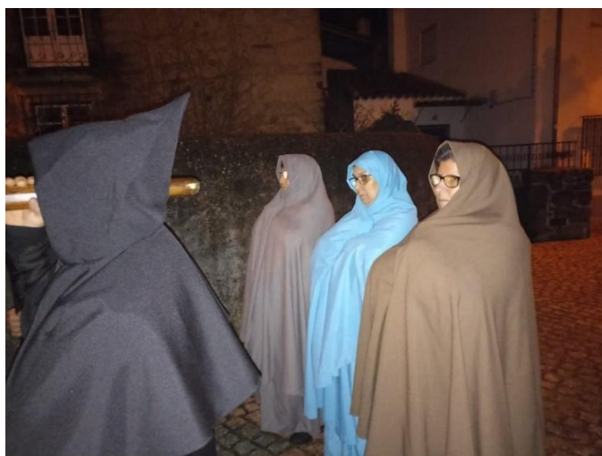
Figura 6 - As três Marias- Procissão do Encontro-Medelim

Em Monsanto, segundo a tradição, todos os anos um grande tronco é transportado até a Igreja de Santa Maria do Castelo para ser queimado em louvor ao Deus Menino. Esta prática foi uma vez proibida por um governador, o que, segundo a lenda, levou a uma série de eventos desafortunados culminando num castigo divino ( Revista Adufe , 2003, 1(1), p. 13). Este evento fortaleceu a determinação da comunidade de Monsanto em manter viva esta prática, que hoje continua a ser um ponto central das celebrações de Natal, simbolizando não só a fé, mas também a resistência cultural da região.