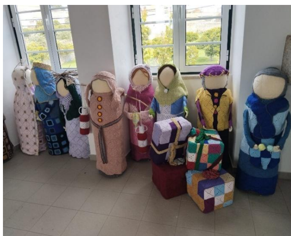
Figura 29 - Figuras de “Natal em Croché”, Medelim

Embora não se considere hábil na técnica — “faço croché muito mal” —, a entrevistada assume a coordenação criativa e logística do projeto, desenhando as peças, organizando os contributos das participantes e montando a estrutura final com a ajuda do marido e de outras pessoas da aldeia: “Eu tenho as ideias, elas fazem os quadradinhos e depois eu monto as peças todas na estrutura”.