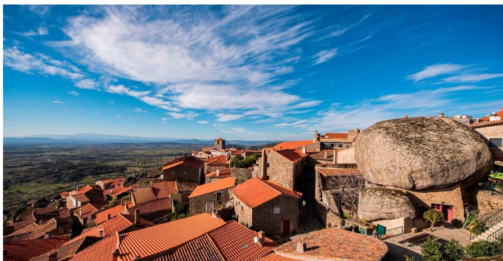
Figura 33 - Vista parcial da aldeia histórica de Monsanto