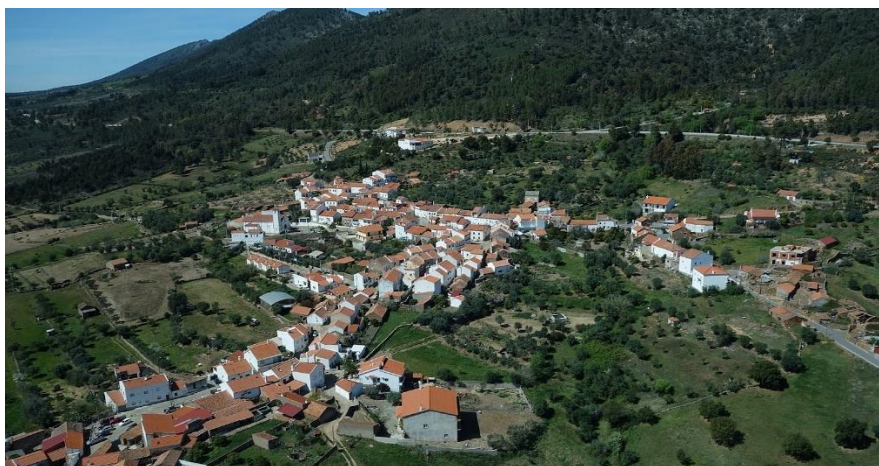
Figura 39 - Vista aérea de Monfortinho

Monfortinho, que em 2013 foi agregada à freguesia de Salvaterra do Extremo, formando a União das Freguesias de Monfortinho e Salvaterra do Extremo, com sede em Monfortinho, conta com 536 habitantes (Wikipédia, 2024). Trata-se de uma localidade bastante antiga, localizando-se na Raia, estando geograficamente separada de Espanha apenas pelo Rio Erges que ali nasce (Câmara Municipal de Idanha-a-Nova, 2025).