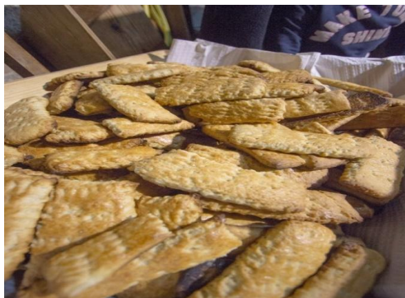
Figura 14 - Borrachões, Festival do Casqueiro em Idanha-a-Velha

O Festival do Casqueiro, anteriormente conhecido como Festival do Pão, Bolos e Tradições, é uma iniciativa que visa resgatar o ciclo completo do pão — da sementeira à cozedura — promovendo oficinas, animação cultural e a participação ativa da comunidade. Esta festividade destaca-se pela valorização do forno comunitário, onde se confeccionam produtos tradicionais como o casqueiro (pão típico da região) e os borrachões (bolos secos típicos da Beira Baixa, confeccionados com farinha, açúcar, azeite e vinho ou aguardente, o que lhes dá o nome peculiar), promovendo não só a valorização do saber-fazer local, mas também a participação ativa da população, em especial das mulheres, na preservação do património cultural imaterial (Aldeias Históricas de Portugal, 2021; LAFIV, 2023).