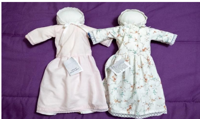
Figura 37 - Maias tradicionais de Penha Garcia [SAPO Viagens, 2021]

em maio, podiam ser destruídas pela intensidade da chuva, comprometendo a subsistência das famílias. As colheitas não só garantiam o alimento do ano, como eram essenciais para o pagamento das rendas dos terrenos (SAPO Viagens, 2021; Andarilho, 2021). Outrora, o ritual incluía uma romagem ao castelo, no dia 3 de maio, onde as raparigas da aldeia erguiam as maias voltadas para a planície, gritando “Viva a Maia do Castelo!”, num gesto performativo que expressava não só proteção contra as intempéries, mas também a valorização da juventude e da fertilidade feminina (SAPO Viagens, 2021).