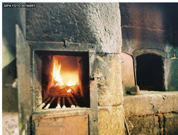
Figura 19 - Boca do forno e zona de combustão do Forno Comunitário de Idanha-a-Velha