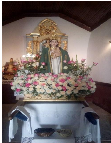
Figura 41 - Nossa Senhora da Consolação, Monfortinho

Em 2022, o Bodo de Monfortinho foi inscrito no Inventário Nacional do Património Cultural Imaterial, reconhecendo a sua importância como reflexo da comunidade e dos contextos