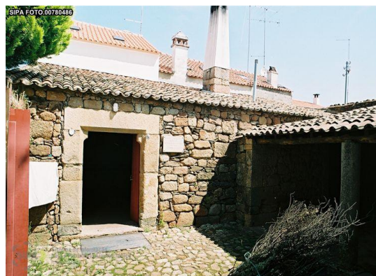
Figura 16 - Fachada principal do Forno Comunitário de Idanha-a-Velha