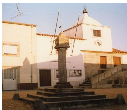
Figura 8 - Pelourinho de Zebreira [SIPA, 1994]

O património edificado local é significativo, destacando-se o Pelourinho de Zebreira, construído em 1686 e classificado como Imóvel de Interesse Público desde 1933.