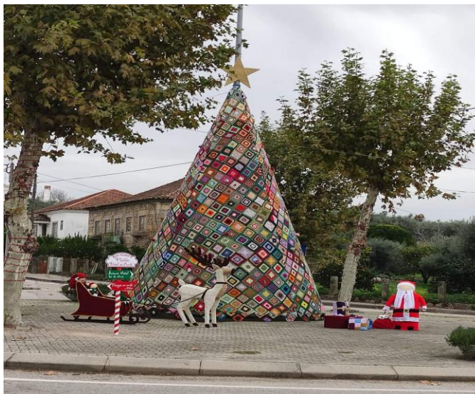
Figura 25 - Árvore, trenó e Pai Natal em Crochet, rotunda de Medelim

início em 2021, elaborada por um grupo de mulheres da aldeia com o apoio da Junta de Freguesia e da comunidade local.