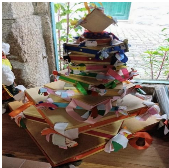
Figura 2 - Adufes- Casa de Artes Tradicionais de Idanha-a-Nova

musical e artesanal, exemplificada pelo Adufe, até às lendas locais e tradições pascais, refletindo as práticas e crenças profundamente enraizadas que continuam a influenciar a vida comunitária.