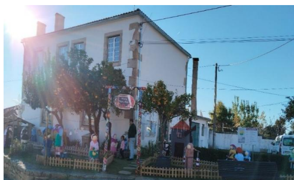
Figura 26 - “Natal em Crochet”, Medelim

O projeto resultou na valorização das técnicas de croché como forma de expressão comunitária e identidade cultural. Mais recentemente, estas mesmas mulheres têm desenvolvido uma representação em croché da própria aldeia, recriando em miniatura algumas das casas, espaços públicos e elementos simbólicos de Medelim. Esta “Aldeia em Croché” não só promove o saber-fazer tradicional, como também reforça os laços sociais e o papel ativo das mulheres na preservação da memória local (SAPO Viagens, 2022).