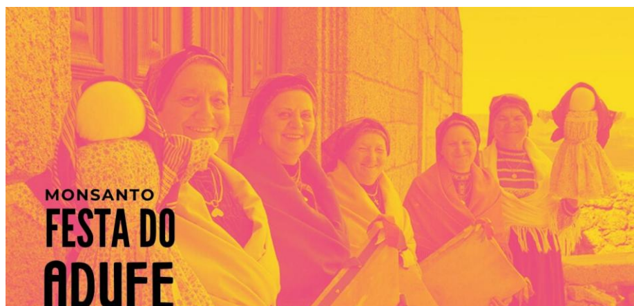
Figura 34 - Adufeiras de Monsanto seguram adufes e marafonas

Deste movimento espontâneo surgiu a atual Festa do Adufe, realizada desde 2022, com caminhadas, workshops , partilhas e o lançamento do pote como momento central (Festa do Adufe, 2025).