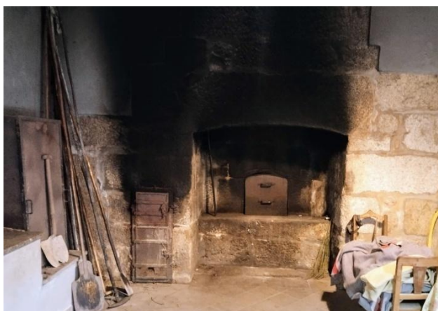
Figura 20 - Forno Comunitário de Idanha-a-Velha