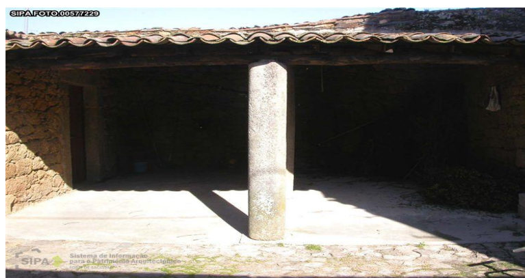
Figura 17 - Pormenor do alpendre lateral do Forno Comunitário de Idanha-a-Velha

O Forno Comunitário de Idanha-a-Velha constitui um elemento patrimonial simbólico e identitário, evocando práticas tradicionais de confeção do pão que, embora hoje reduzidas a momentos pontuais e sustentadas pelo esforço individual de uma guardiã local, continuam a desempenhar um papel relevante na afirmação cultural da comunidade, embora em contexto festivo. Edificado em alvenaria de granito e localizado na Rua do Castelo, próximo à igreja matriz, este espaço mantém a sua estrutura original, composta por uma sala ampla, bancadas laterais e um forno abobadado, preservando as características da arquitetura vernácula regional.