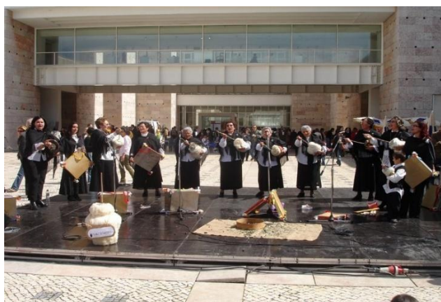
Figura 9 - Atuação do Grupo de Cantares Tradicionais Saca Sons

A vida cultural da vila é dinamizada por associações como a Tuna da Zebreira e o Grupo Saca Sons, que têm desempenhado um papel relevante na preservação e revitalização das tradições musicais e festivas locais (Wikipédia, 2025).