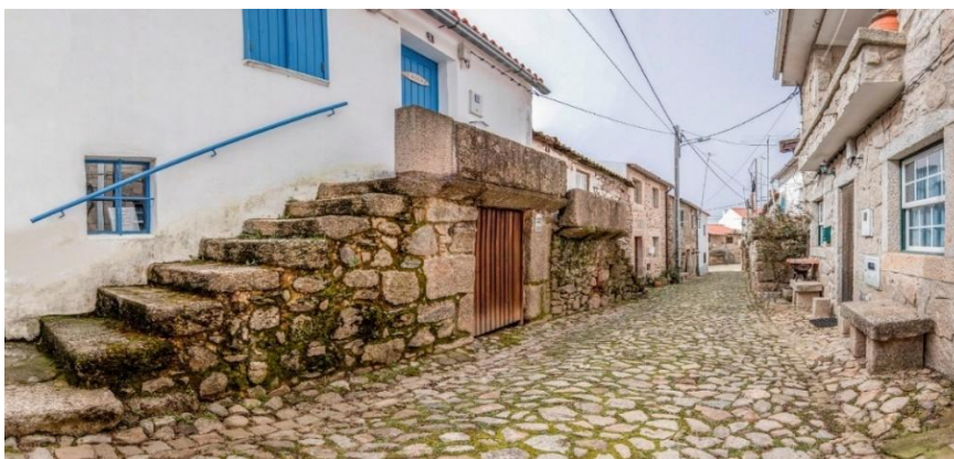
Figura 23 - Casa tradicional com balcão, Rua da Judiaria, Medelim

A aldeia de Medelim conta com uma área de 30,47 km 2 e uma população de 230 habitantes segundo os Censos de 2021, apresentando uma densidade populacional de 7,5 hab./km 2 (Wikipédia, 2021). Conhecida como a “Aldeia dos Balcões”, Medelim destaca-se pelas suas casas tradicionais com varandas em granito, testemunho da arquitetura vernacular da região (Câmara Municipal de Idanha-a-Nova, 2024).