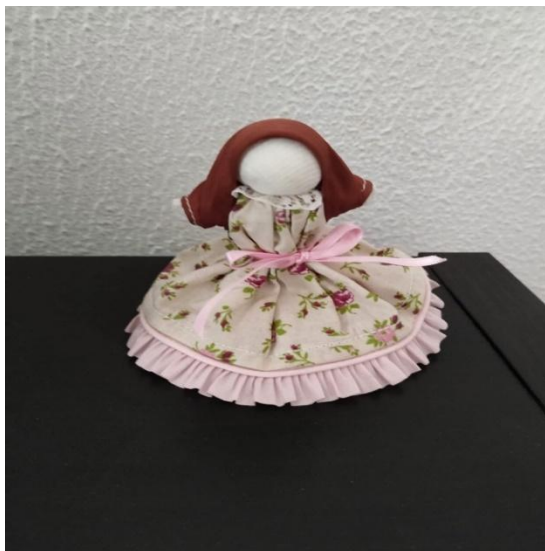
Figura 4 - Marafona

Este destaque na música e no artesanato local demonstra como o adufe é mais do que um instrumento; é um símbolo da identidade e do património cultural de Idanha-a-Nova.