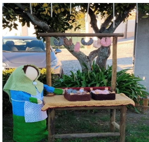
Figura 30 - Boneca com fumeiro, “Natal em Croché”, Medelim

A prática do croché em Medelim ganhou visibilidade com a criação da árvore de Natal em 2021. Desde então, o projeto evoluiu para um presépio em croché — com novas figuras todos os anos — e para uma verdadeira Aldeia de Natal, com representações que vão além do quotidiano imediato, incorporando profissões, objetos e costumes que remetem à memória coletiva da comunidade e que funcionam como formas de auto-representação simbólica e identitária: “O presépio começou com sete peças. Depois fizemos o moinho, o Pai Natal, as hortas... Agora já é uma aldeia de Natal”.