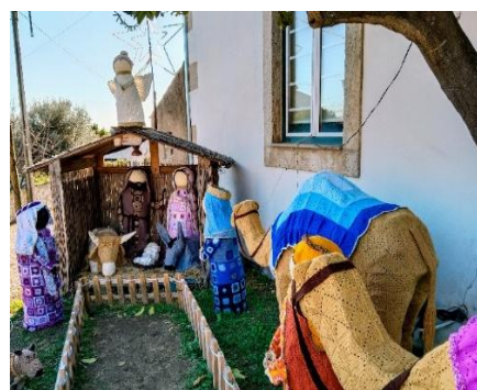
Figura 27 - Presépio no “Natal em Crochet”, Medelim