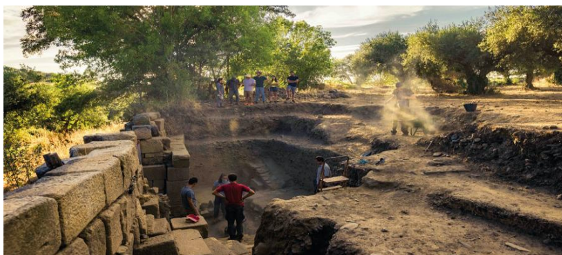
Figura 12 - Escavações arqueológicas em Idanha-a-Velha revelando um forno de origem romana [National Geographic Portugal, 2023]

Idanha-a-Velha, a segunda aldeia aqui apresentada, integra atualmente a União das Freguesias de Monsanto e Idanha-a-Velha, tendo sido sede de concelho até à sua extinção administrativa em 1879. Conta com 63 habitantes (Wikipédia, 2014).