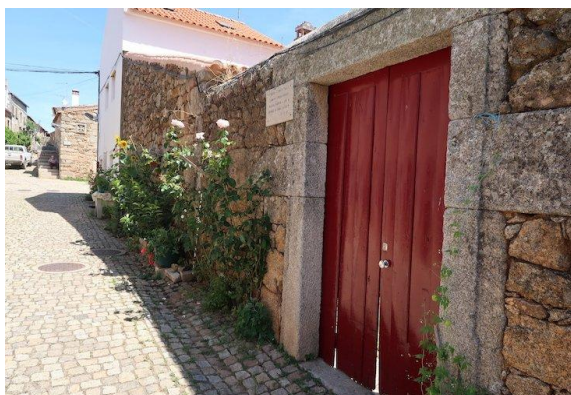
Figura 15 - Entrada do forno comunitário de Idanha-a-Velha

destaca-se ainda pela promoção da igualdade de género, com 50% dos seus órgãos sociais compostos por mulheres, refletindo um compromisso com a inclusão e a representatividade na comunidade (LAFIV, 2023).