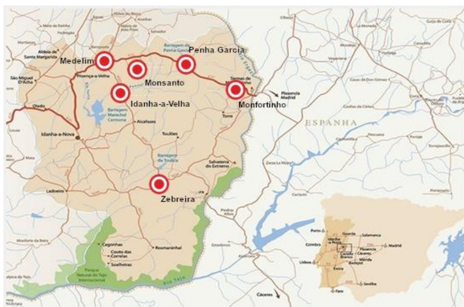
Figura 1 - Mapa de Idanha-a-Nova

Situada na região da Beira Baixa, no centro de Portugal, enquadrada pelos concelhos de Penamacor, Castelo Branco, Fundão e por Espanha, Idanha-a-Nova destaca-se pela sua vasta extensão territorial e posição estratégica na fronteira com o país vizinho. É sede de um dos maiores municípios de Portugal, como referido, com 1.412,73 km 2 de área, subdividido em 17 freguesias.