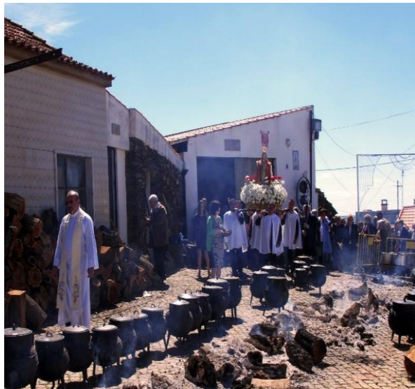
Figura 40 - Procissão e confeção comunitária do tradicional Bodo de Monfortinho

Monfortinho é amplamente reconhecida pela organização do tradicional Bodo de Monfortinho, um festejo popular ancestral realizado como forma de agradecimento a Nossa Senhora da Consolação por ter livrado os campos e searas, em 1870, de uma devastadora praga de gafanhotos. Esta festividade, que ocorre anualmente, 10 dias após a Páscoa, durante três dias, é considerada uma das mais singulares do país, integrando o património cultural e social do concelho de Idanha-a-Nova (Idanha.pt, 2024).