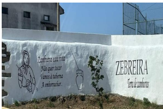
Figura 7 - Arte urbana na Zebreira destacando a Zamburra [Mais Beiras, 2023]

Zebreira, uma das aldeias do concelho de Idanha-a-Nova, foi sede da freguesia de Zebreira, extinta em 2013, no âmbito de uma reforma administrativa nacional, sendo agora a sede da União das Freguesias de Zebreira e Segura. Tem atualmente 873 habitantes, constituindo uma povoação com terrenos bastante férteis, onde predominam o cultivo das oliveiras, árvores de fruto e cereais (Wikipédia, 2014).