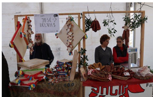
Figura 13 - Bancas de produtos regionais no Festival do Casqueiro em Idanha-a-Velha

O Festival do Casqueiro, anteriormente conhecido como Festival do Pão, Bolos e Tradições, é uma iniciativa que visa resgatar o ciclo completo do pão — da sementeira à cozedura — promovendo oficinas, animação cultural e a participação ativa da comunidade. Esta festividade destaca-se pela valorização do forno comunitário, onde se confeccionam produtos tradicionais como o casqueiro (pão típico da região) e os borrachões (bolos secos típicos da Beira Baixa, confeccionados com farinha, açúcar, azeite e vinho ou aguardente, o que lhes dá o nome peculiar), promovendo não só a valorização do saber-fazer local, mas também a participação ativa da população, em especial das mulheres, na preservação do património cultural imaterial (Aldeias Históricas de Portugal, 2021; LAFIV, 2023).