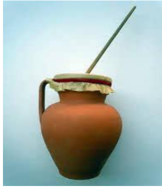
Figura 10 - Exemplo de Zamburra tradicional