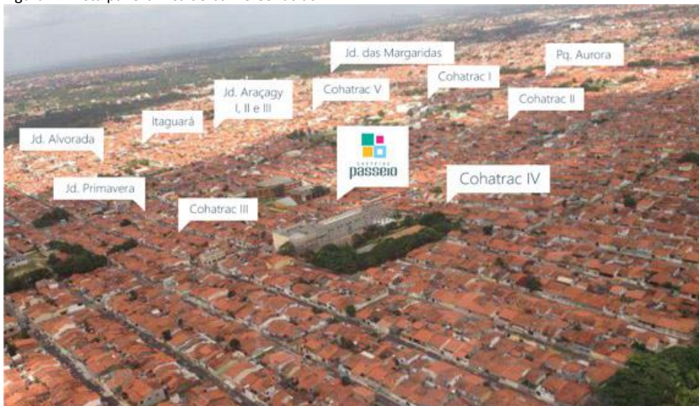
Figura 1 - Vista panorâmica do bairro Cohatrac