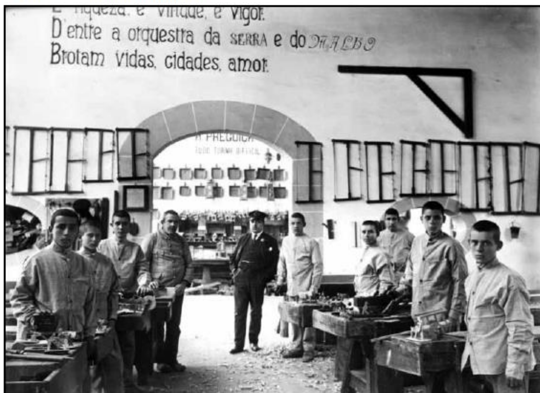
Figura 3 - Oficina de carpintaria