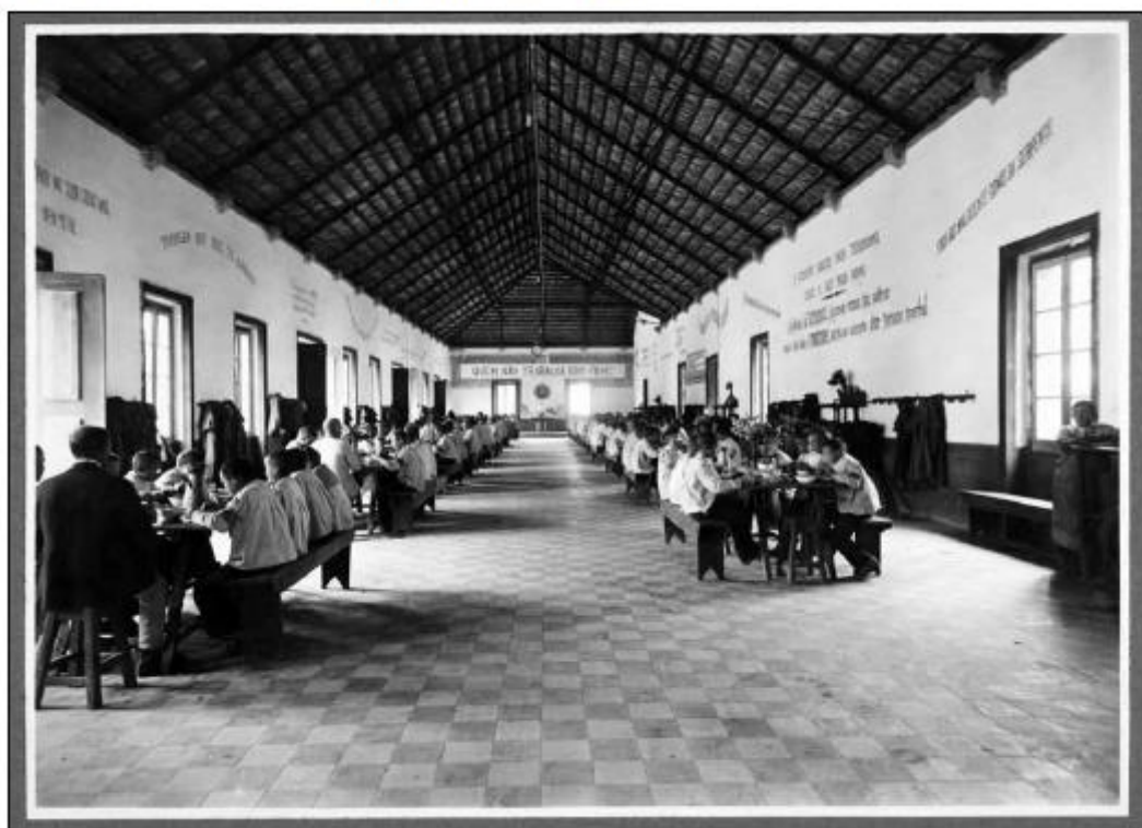
Figura 1- Refeitório com as frases nas paredes