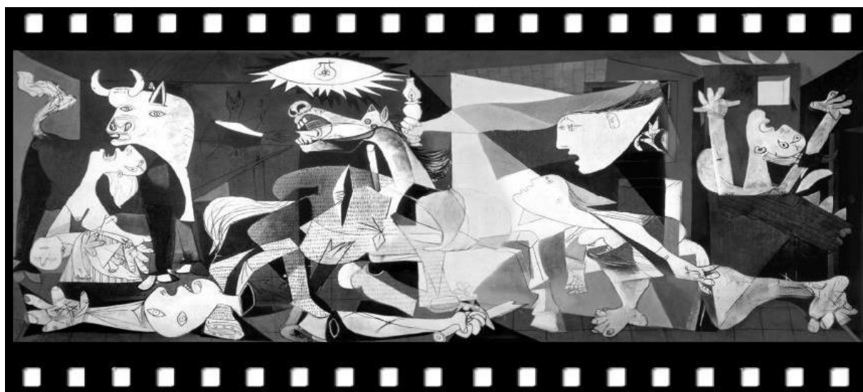
( Guernica , de Pablo Picasso – 1937)

Uma abordagem a partir do Universo Musical