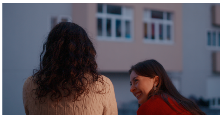
Figura 7 - Still de Mais Alto (2025)

Neste momento, a nova partilha entre as personagens surge como uma forma de estabelecer cumplicidade que ultrapassa o desejo ou a tensão inicial. Torna-se um pacto de reconhecimento mútuo, uma espécie de escuta entre iguais, onde já não há hesitação, mas espaço de partilha. É uma cumplicidade construída não por acontecimentos exteriores, mas por presença: por aquilo que se sustentou entre os silêncios e os gestos ao longo da curta-metragem. A montagem, ao permitir que esta transição se dê com tempo, reafirma uma forma de narrar que privilegia a profundidade da experiência interior que é afirmada nesta cena final de forma sólida.