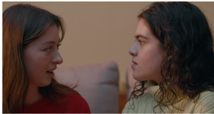
Figura 5 - Still de Mais Alto (2025)

Quando o beijo entre Clara e Lívia acontece, não é tratado como uma explosão de emoção nem como um momento de viragem abrupta. Pelo contrário, é a cristalização de uma linguagem que vinha sendo construída. É um gesto que inscreve na continuidade do silêncio e da hesitação. A montagem respeita-o dessa forma: sem dramatização, sem realce musical ou visual, mas como uma espécie de libertação contida que, precisamente por não ser grandiosa, é profundamente realista.