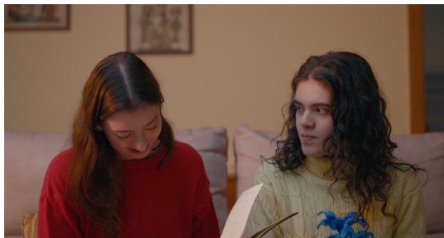
Figura 3 - Still de Mais Alto (2025)

A conversa entre Clara e Lívia , embora aparentemente circunstancial, carrega consigo um subtexto denso que é enaltecido devido ao facto de a montagem ter estado, lentamente, a guiar o espectador para esta tensão que existe entre as duas personagens. A conversa, nesta instância, gira em torno de temas banais (os desenhos do caderno, amigos, etc.), mas os seus gestos e olhos contam outra história que está a acontecer em paralelo. O diálogo funciona como uma cortina que cobre os pensamentos das personagens: o verdadeiro conteúdo da cena é veiculado através das microexpressões, dos silêncios, das pausas, dos olhares. A montagem compreende isto e age em conformidade, recusando sobrepor significados àquilo que está a acontecer e em vez disso dá tempo à ambiguidade.