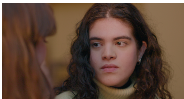
Figura 4 - Still de Mais Alto (2025)