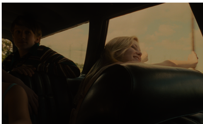
Figura 1 - Still de "The Virgin Suicides" (1999)