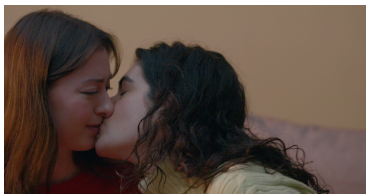
Figura 6 - Still de Mais Alto (2025)