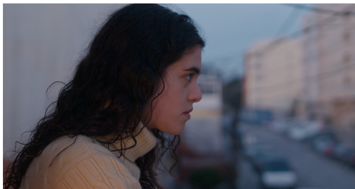
Figura 8 - Still de Mais Alto (2025)

Esta cena marca um ponto de viragem no filme, não apenas pelo que acontece objetivamente, mas pela força daquilo que permanece em aberto. É um final profundamente relacionado com o female gaze : não espetacular, mas sensível, não explosivo, mas intensamente vibrátil. O espaço, o tempo e a banda sonora são as matérias da montagem e é no modo como a edição os organiza que se desenha o verdadeiro arco: o reconhecimento de um desejo nascente, a abertura ao outro, o início de uma intimidade.