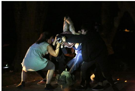
Fotografia 14 e 15