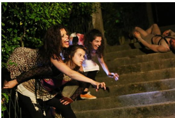
Fotografia 17, 18 e 19.