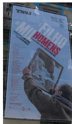
Fotografia 3 e 4

A par dos espectáculos, o Teatro Bruto realizou acções de formação na área do teatro, dirigidas a um público tão amplo quanto possível com direcção artística da encenadora residente Ana Luena. Participei numa destas formações que tinha como objectivo uma apresentação pública de um espectáculo no Mosteiro de São Bento da Vitória – “Projecto K”- que me despertou interesse por partir da selecção de textos de Franz Kafka.