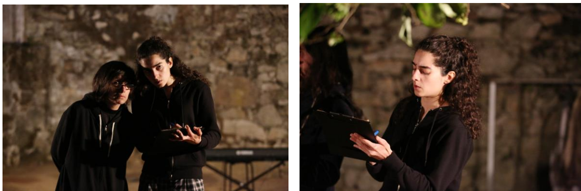
Fotografia 7 e 8