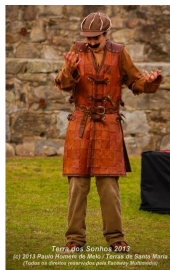
Fotografia 1 e 2

Em Junho de 2014 participei numa performance de Teatro físico no Mercado do Bom Sucesso, baseada na peça “Despertar da Primavera”, de Frank Wedekind, encenada por Diogo Costa Reis. Também aqui, deparei-me com a utilização da expressão corporal como veículo de comunicação, visto não haver linguagem verbal. Esta performance foi o resultado de improvisações em grupo e de partilha de histórias pessoais de amor, sofrimento e felicidade.