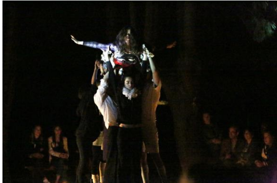
Fotografia 12 e 13