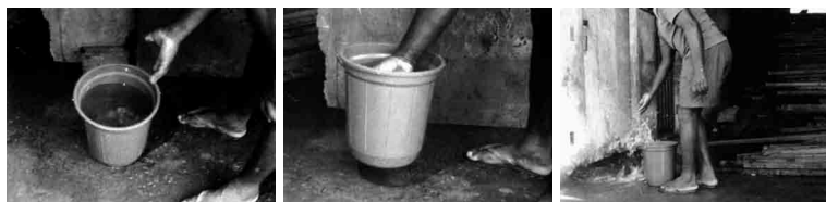
Figuras 6, 7 e 8. Fotogramas de About the density of water (Gusmão & Paiva, 2009).

Gerald Prince considera as imagens (estáticas e em movimento) como fazendo parte da ‘linguagem de signos’, um dos ‘meios de representação das narrativas’, a par das linguagens escrita e falada (Prince, 1987). No seu “ A Dictionary of Narratology ”, a definição de “narrativa” ocupa três páginas e espalham-se por dez as diferentes entradas que provêm morfológicamente da palavra ou que a usam para compor conceitos derivativos. De uma forma resumida, Prince define a narrativa como sendo