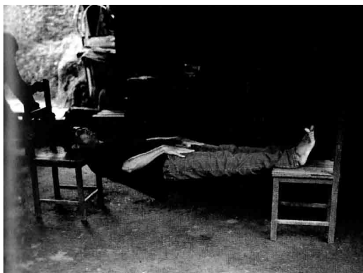
Figura 9. A tábua humana Gusmão & Paiva, 2009).