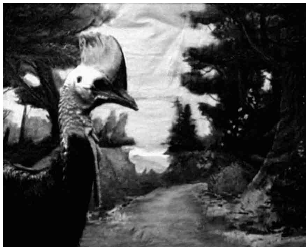
Figura 10. Fotograma de Casuar (Gusmão & Paiva, 2010).