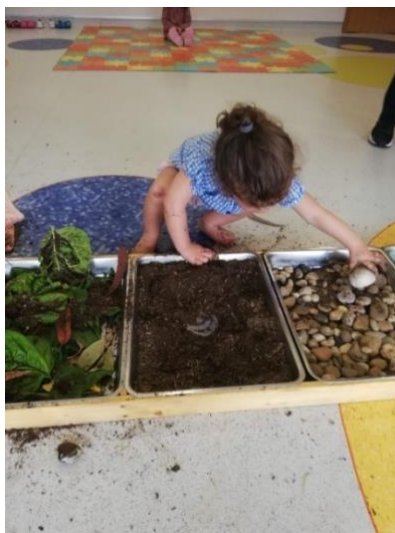
Figura 3 Criança a explorar os diferentes elementos naturais