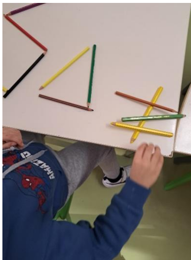
Figura 5 Construção de uma das crianças

Na segunda etapa, a mestranda começou a questionar o grupo se os tipos de figuras que estavam a fazer eram iguais ou diferentes e se sabiam a diferença entre linhas fechadas e linhas abertas. A educadora em formação exemplificou, com os materiais e no quadro, a diferença entre estes dois tipos de linhas, uma vez que o grupo demonstrou desconhecimento sobre esta temática.