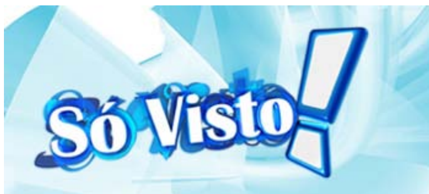
Fig. 5 – Logotipo do programa