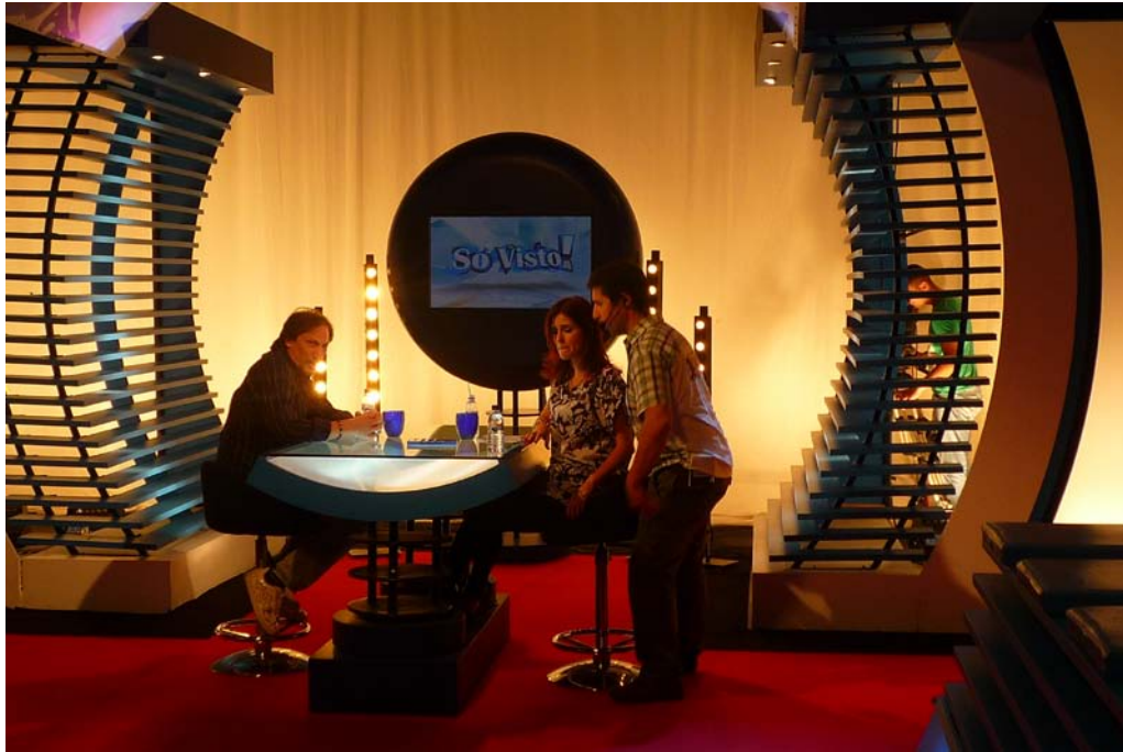
Fig.2.1 – Estúdio