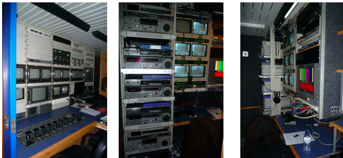
Fig. 4 – Regie - Controlo de imagem e videotape