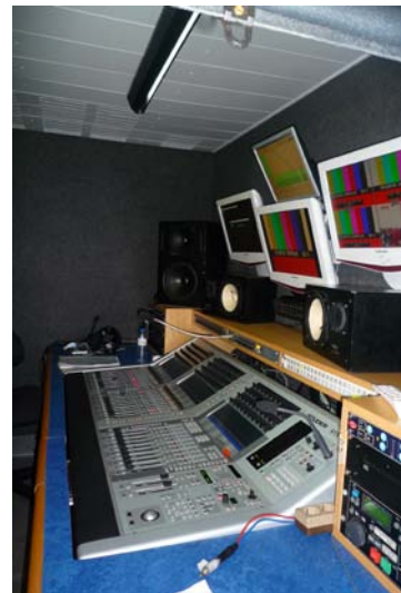
Fig. 3 – Regie – mistura de imagem e mistura de som