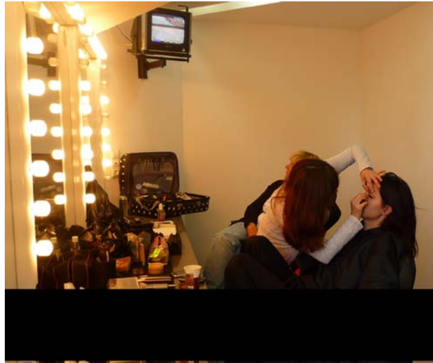
Fig.1 – Sala de caracterização