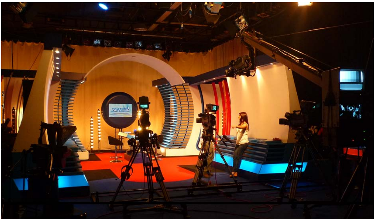
Fig.2 - Estúdio