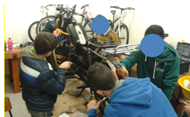
Figura 3 – Fotografia da esquerda escolhida por A; fotografia da direita escolhida por B