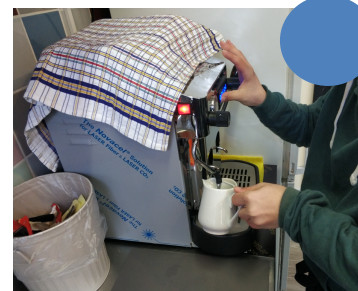
Figura 5 – Fotografia da esquerda escolhida por C; fotografia do meio tirada por B; fotografia da direita tirada por A