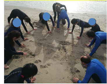
Figura 2 – Fotografia da esquerda tirada por D; fotografia do meio escolhida por D; fotografia da direita escolhida por C