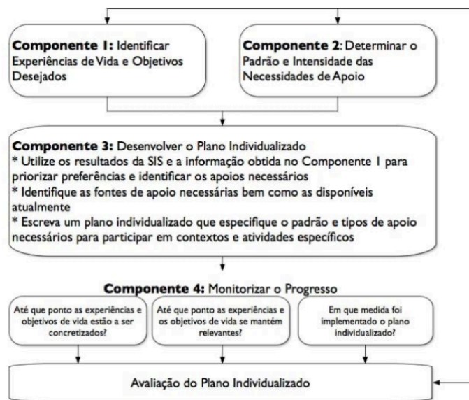
Figura 1 – Quatro componentes do processo de desenvolvimento de uma planificação individualizada (Thompson et al., 2002)

amigos como fulcrais no apoio aos jovens, bem como a particular importância em atender às capacidades e ambições ao invés de considerar as suas limitações. Estes planeamentos procuram ainda ter em conta os apoios e rotinas proporcionados pela comunidade em geral (Marrone, Hoff, & Helm, 1997).