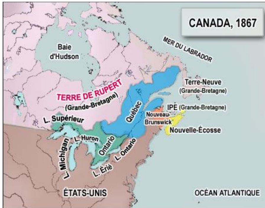
Figure 5 Canada, 1867

mais après la loi qui visait à restreindre l'usage du français en Ontario et la mobilisation obligatoire pendant la Première Guerre Mondiale, Henri Bourassa prône un nationalisme canadien-français et défend vigoureusement les droits des Canadiens-francophones.