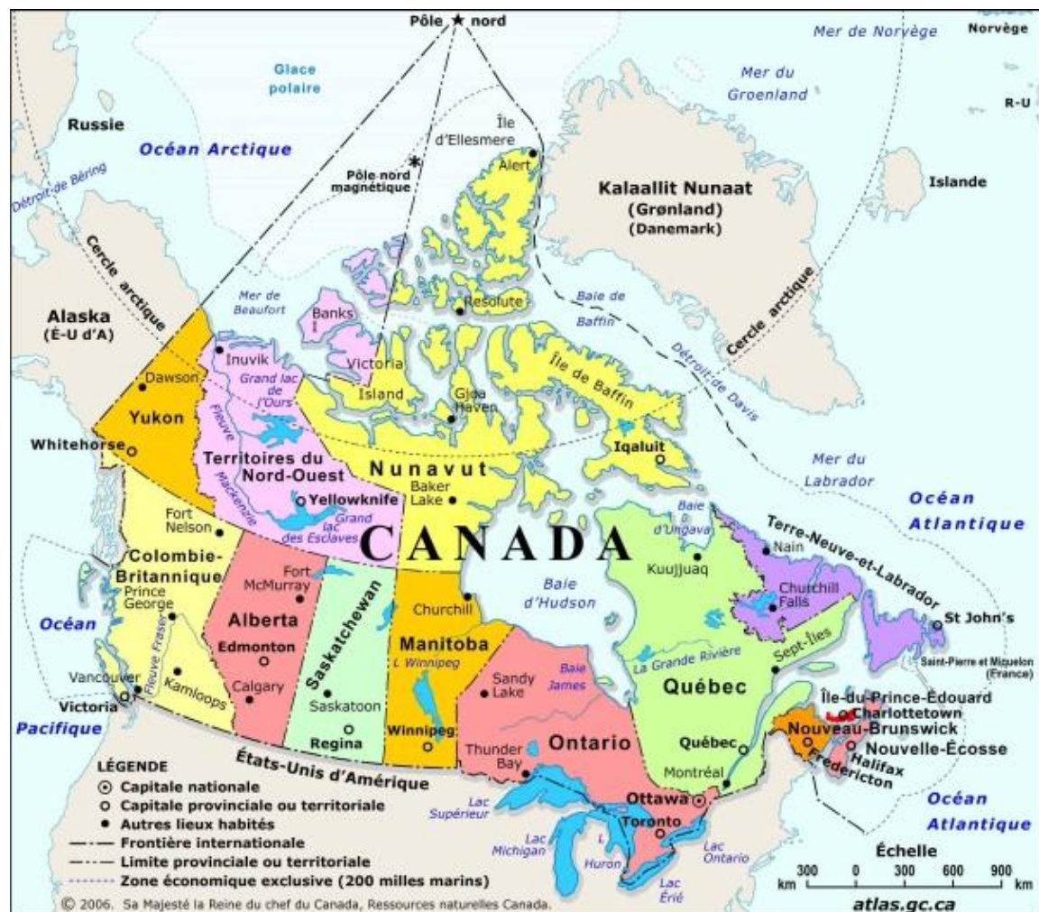
Figure 2 La fédération canadienne

Le Canada est le deuxième plus grand pays du monde en superficie, après la Russie et sa capitale est Ottawa. Il a 34 millions d'habitants dont la majorité est protestante et il occupe la région septentrionale de l'Amérique du Nord. C'est une fédération de dix provinces et trois territoires.