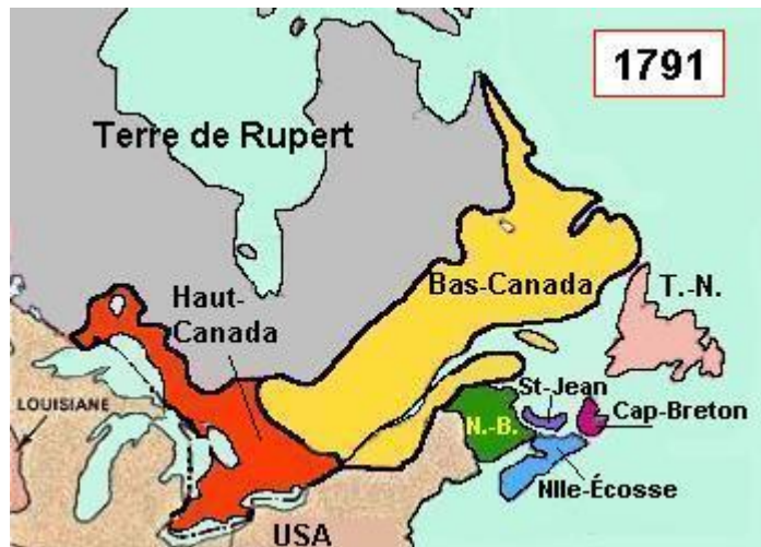
Figure 3 La création du Haut-Canada et du Bas-Canada (1791)