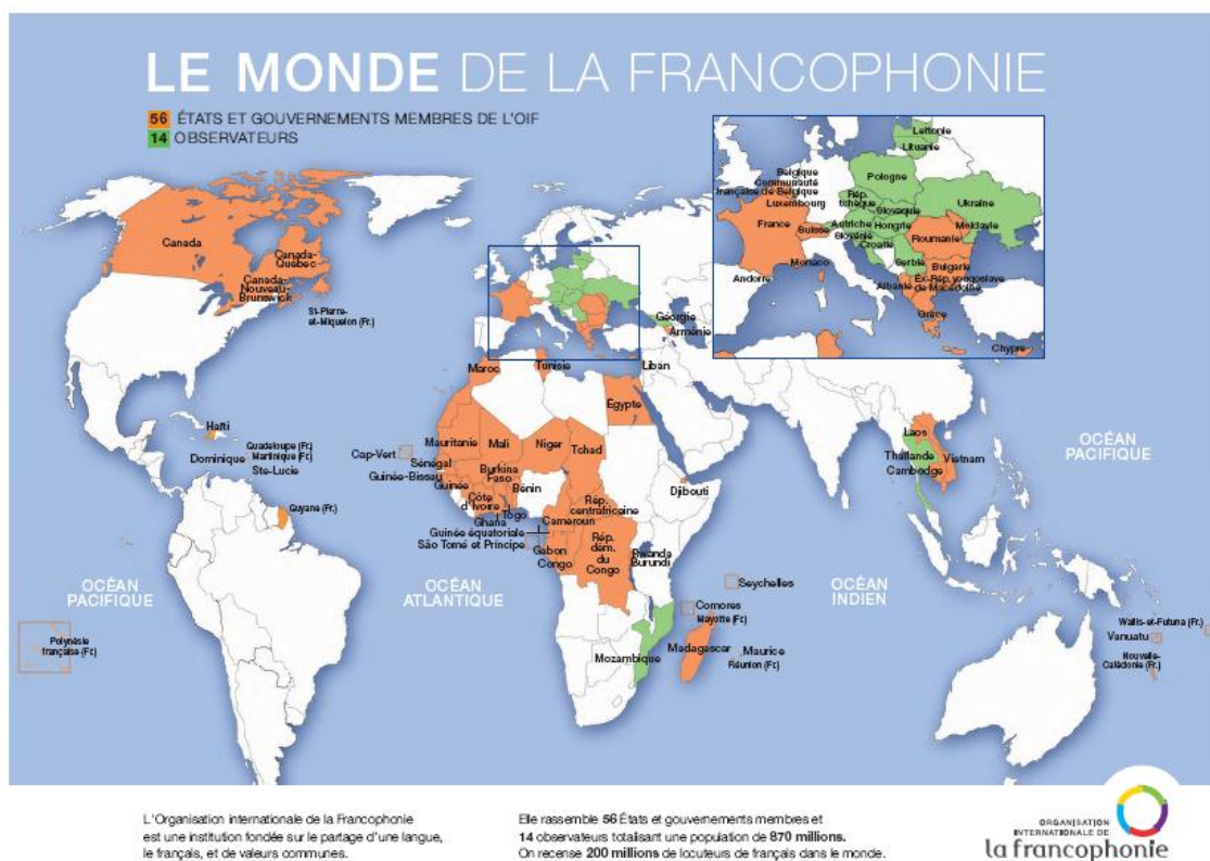
Figure 1 Le monde de la francophonie

La France est cependant le point d’ancrage de la francophonie et les francophones du Canada et surtout les Québécois sont aussi très impliqués dans ce mouvement de la francophonie qui a été un moteur important dans leur prise de conscience culturelle et politique.