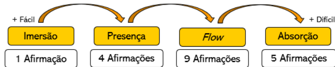
Figure 2. Ordem de dificuldade das subescalas

Considerando o mesmo estudo sobre o envolvimento do jogador, é constatado que é possível colocar as diversas fases por ordem de dificuldade, da mais fácil de atingir, até à mais difícil, começando pela imersão, passando pela presença, pelo flow e terminando em absorção, como observado na Fig. 2.