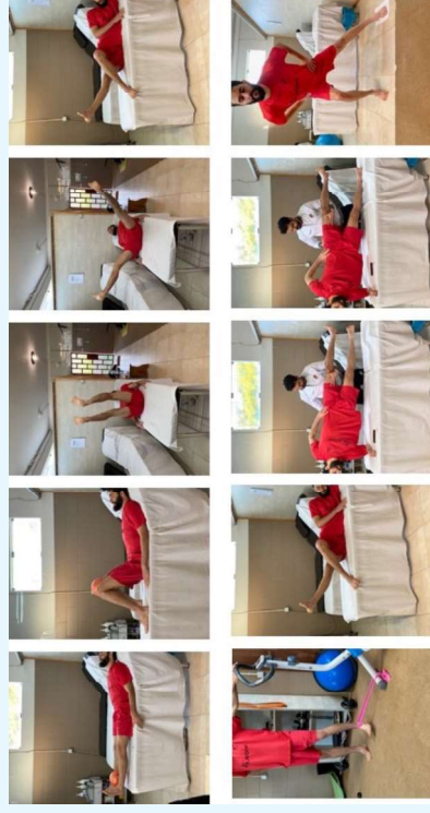
Exercícios específicos para os adutores