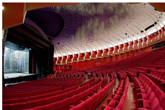
Teatro Regio di Torino

Director de Cena = Direttore di palcoscenico ou Direttore di scena