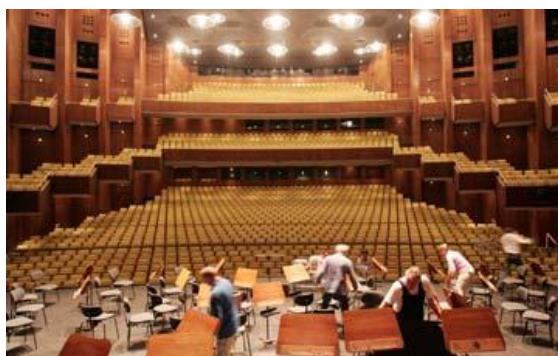
Deutsche Oper – Berlim