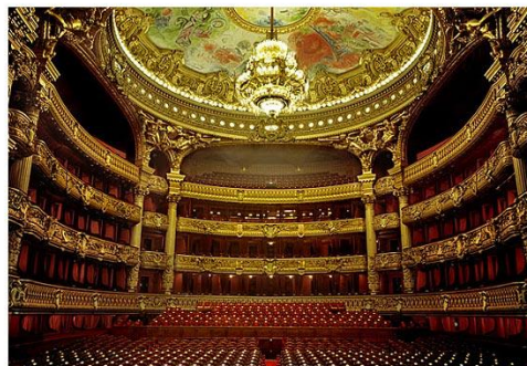
L'Opéra de Paris