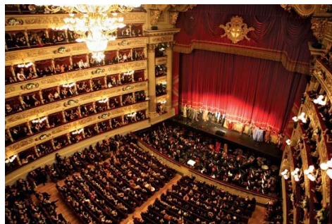
Teatro Alla Scala Millano