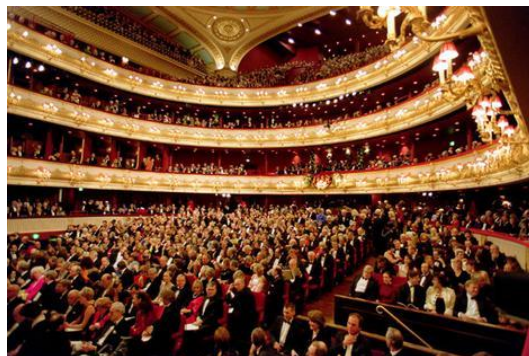
Royal Opera House — Covent Garden