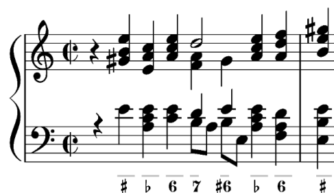
Imagem 7 Realização do mesmo compasso, agora em stilo pieno.

Com as cifras aprendidas e feita uma boa condução, inicia-se a segunda etapa. Aqui, com base na nossa realização prévia, passamos agora a fazê-la em estilo pleno, o estilo com o qual Pasquini acompanhava: