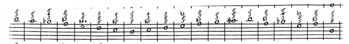
Imagem 2 Regra da oitava em ré menor, J. F. Dandrieu, Principes de l'Accompagnement du Clavecin , 1718.