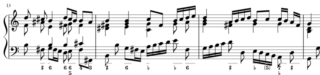
Imagem 10 Compassos 13-16 do segundo andamento do Basso XIV

A segunda versão esteve marcada pela busca da rigorosidade em todos os aspetos: formal, motivico, dinâmico, contrapontístico... Com o objetivo de tornar a realização o mais coerente possível em si mesma e o mais acorde ao estilo composicional de inícios do séc. XVIII. Assim, destaca uma maior utilização do contraponto e dos pontos imitativos com o baixo.