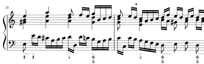
Imagem 9 Compassos 25-26 do segundo andamento do Basso XIV

Como já foi referido, o contraponto e a imitação também estão presentes nesta realização: