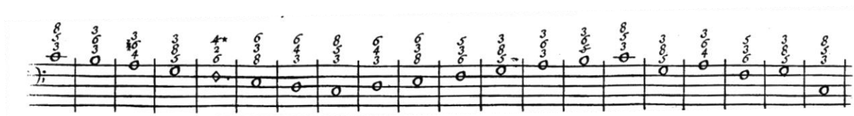
Imagem 1 Regra da oitava em dó maior, J. F. Dandrieu, Principes de l'Accompagnement du Clavecin , 1718.

padrão que os continuistas aprendiam como fórmulas como se pode observar na regra da oitava . Ainda que tenha aparecido da mão de um compositor francês, François Campion, e a sua codificação tenha sido tardia, 1716, pois a teoria sempre aparece depois da prática, a regra da oitava é um bom exemplo de até que ponto as fórmulas foram usadas no ensino dos continuistas. Define a harmonia a realizar em qualquer ponto da escala, seja esta maior ou menor, tanto ascendente como descendente. Desta forma, a título de exemplo, numa escala maior, um IV grau que ascende a um V levará a harmonia 6/5/3, o que indica um acorde de quinta e sexta; e um IV grau que desce a um III levará a harmonia 6/4/2, o que indica um acorde maior com a sétima no baixo.