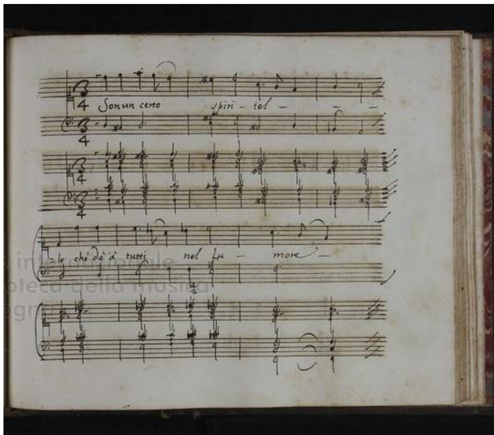
Imagem 4 Primeira página da cantata "Son un certo spiritello", Anónimo, I-Bc Ms. E. 25.