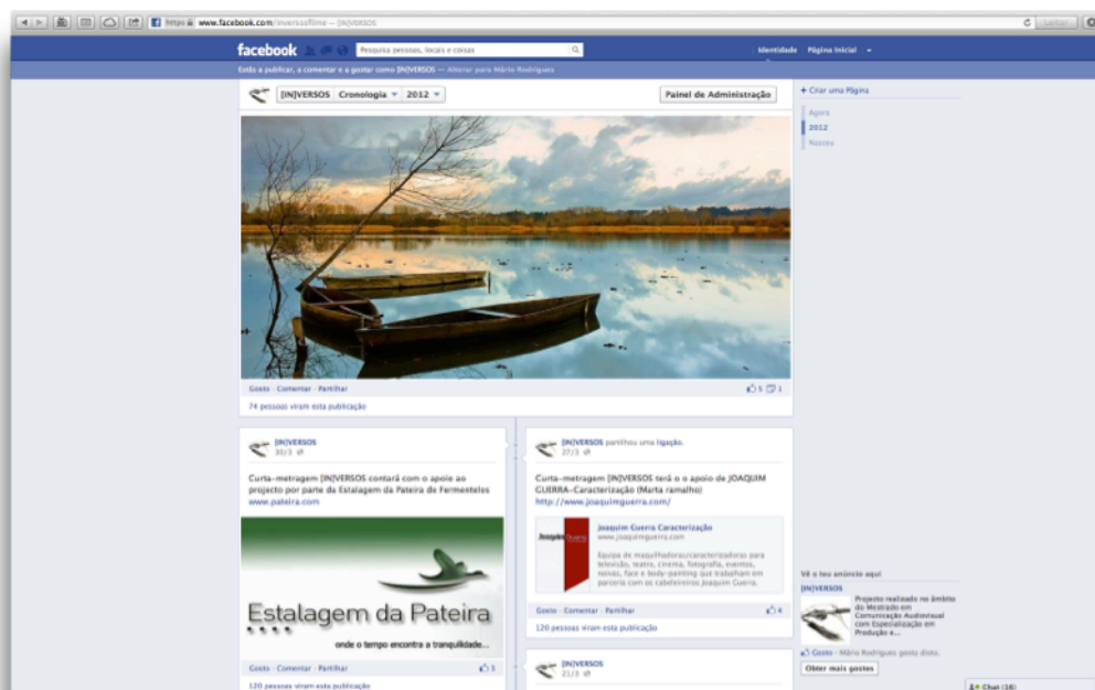
Presença no Facebook da curta-metragem [IN]VERSOS