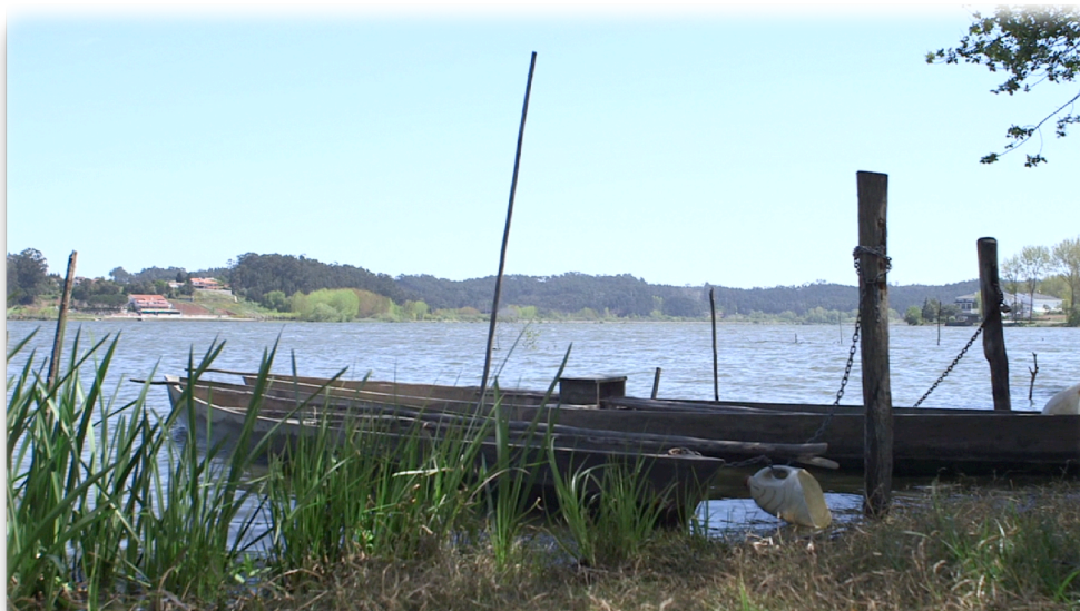
Imagem sem correção de cor