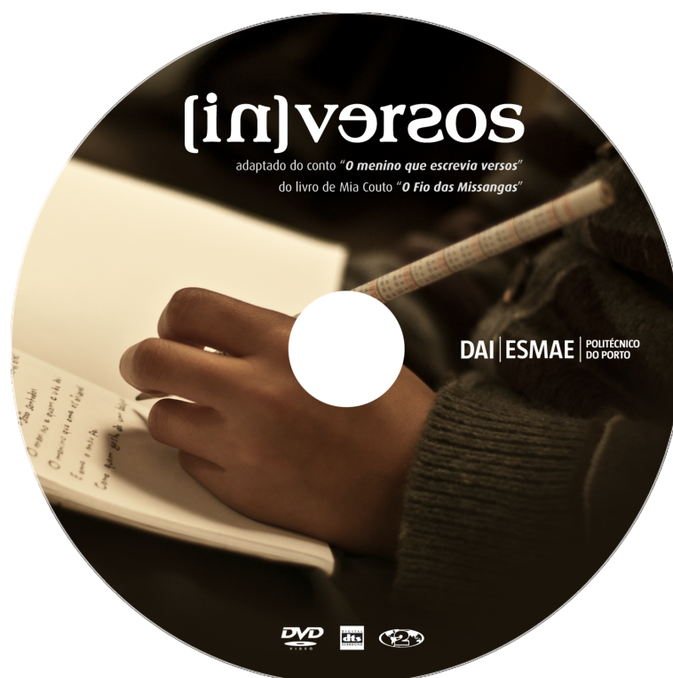
DVD-Vídeo interativo de apresentação do filme