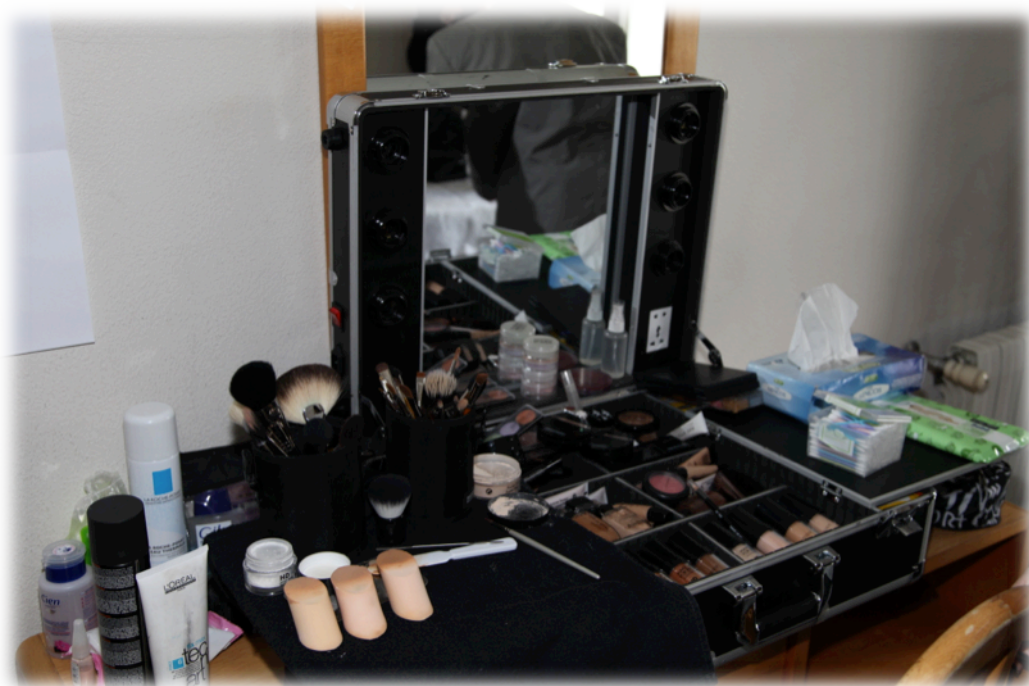
Equipamentos para maquilhagem e cabeleireiro