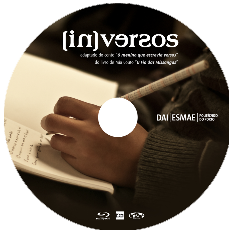
Bluray interativo de apresentação do filme