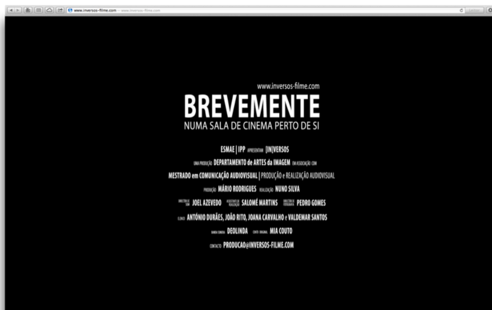
Página internet da curta-metragem [IN]VERSOS