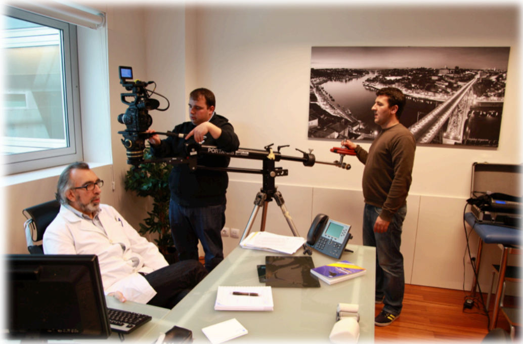
Filmagens utilizando mini-jib no Hospital da CUF no Porto