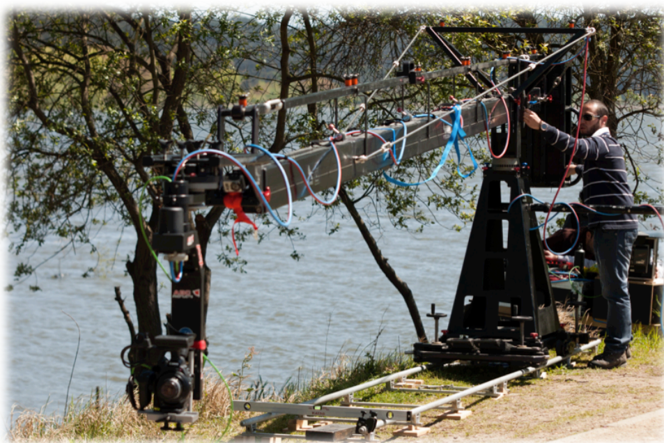
Filmagens utilizando a grua Panther em Fermentelos