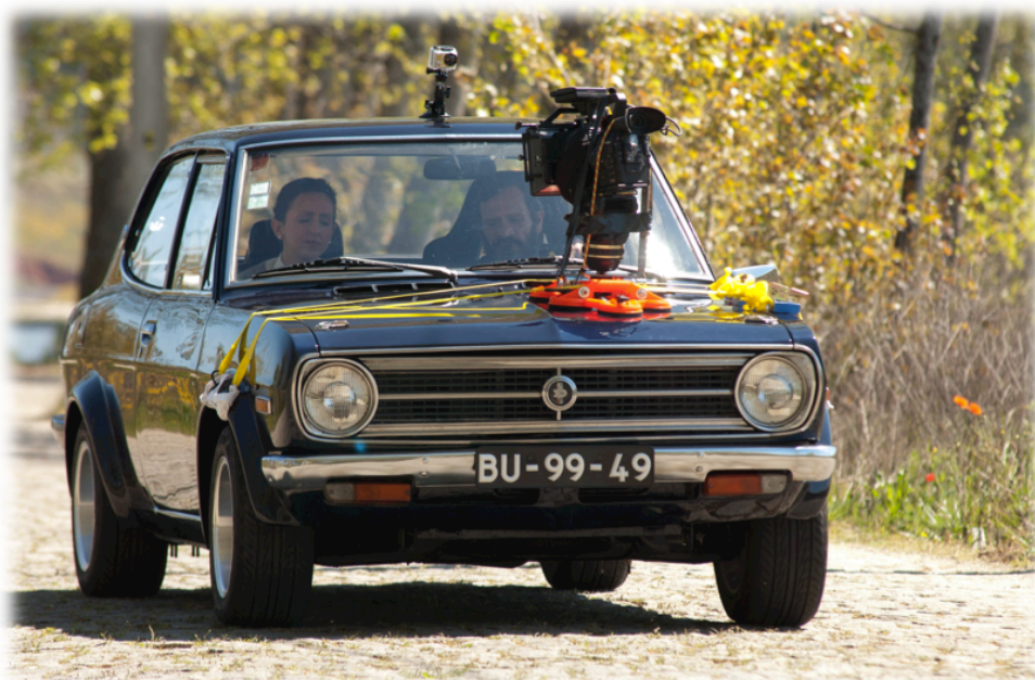
Filmagens utilizando carmount 1 em Fermentelos