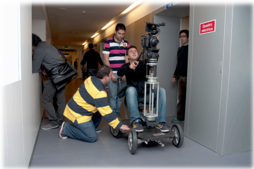
Filmagens utilizando dolly no Hospital da CUF no Porto