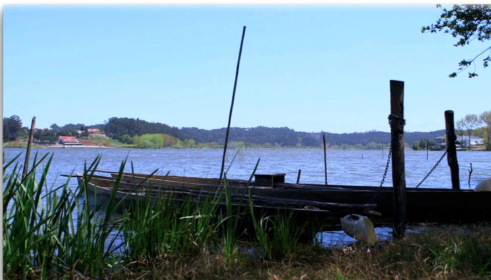
Imagem com correção de cor