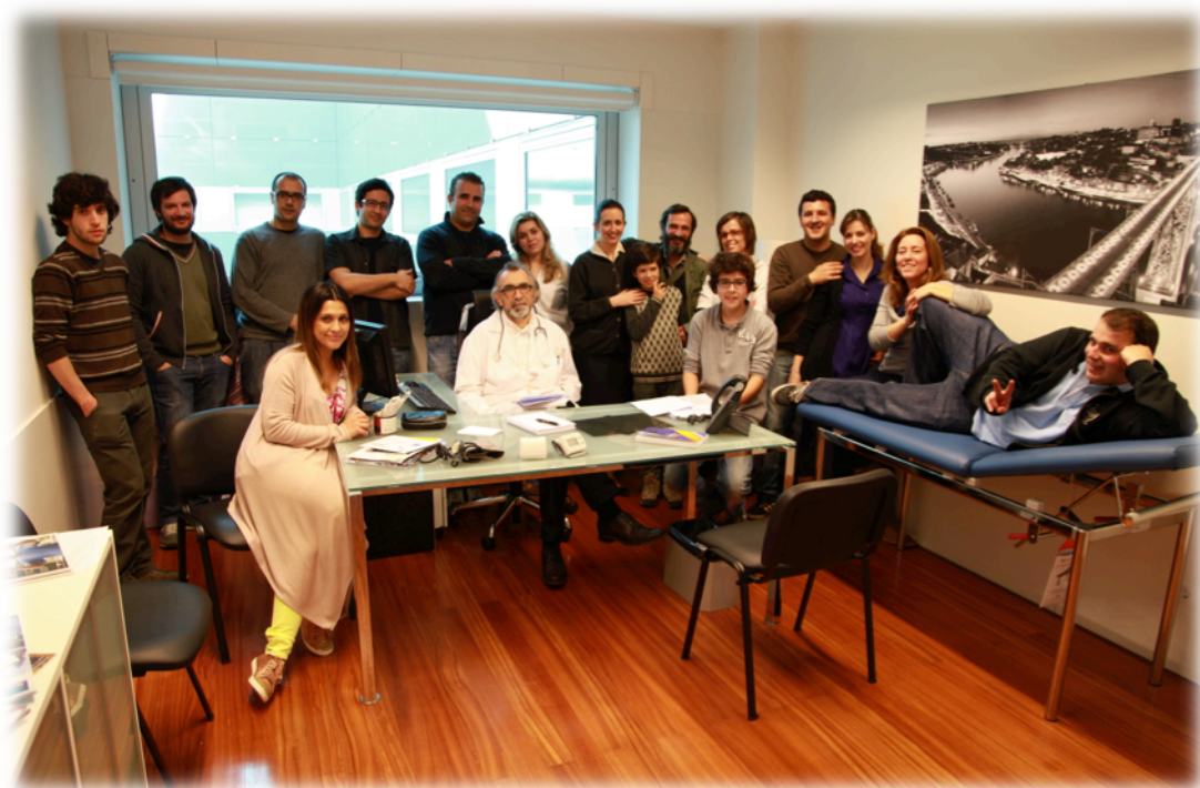
Elenco e equipa técnica do [IN]VERSOS | dia final de rodagem

Sinopse | Um casal decide levar o filho ao médico porque este escreve versos. Inicialmente, o médico informa os pais que o seu consultório não é uma clínica psiquiátrica, mas depois de ler os versos, fica fascinado com a escrita do menino e decide criar um espaço no seu consultório para que este possa dar largas à sua imaginação.