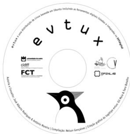
Figura 2: DVD da distribuição EVTux

utilizado com alguma abrangência, no seu sentido mais lato designando todo o software sobre o qual é permitido acesso à totalidade ou parte do seu código-fonte, independentemente de outras restrições ou limitações impostas. Assim, a OSI registou a marca “Open Source Initiative Approved” e apenas permite a sua utilização em software que é distribuído com uma licença que respeite os princípios definidos na Open Source Definition (Perens, 1999). A natureza algo vaga da designação obrigou à redação de uma definição que permitisse estipular claramente os limites do que constitui o software designado por Open Source , realçando que o acesso ao código-fonte do software é condição necessária mas não suficiente. A definição de Open Source foi redigida por Bruce Perens (1999) segundo 10 princípios que o EVTux cumpre, podendo esta considerar-se uma distribuição livre - Software Livre , pois também respeita as quatro liberdades definidas por Richard Stallman (Gay, 2002). A perspetiva de integração das TIC em contexto educativo é reforçada pelo surgimento de recursos Web, Web 2.0 e software livre, novos estímulos à aprendizagem de conceitos ligados à expressão plástica, educação artística, às artes visuais e plásticas e à EVT. É nesta perspetiva de integração das TIC em contexto educativo que reside a génese do EVTux (Figura 2).