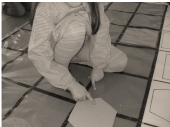
Figura 2. Criança a Analisar um Hexágono