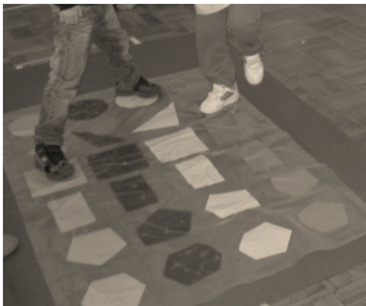
Figura 5. Crianças a Jogar o Twister Geométrico