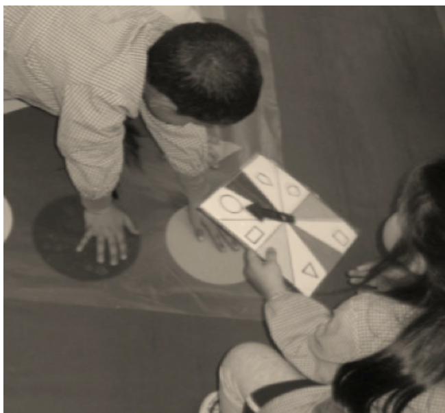
Figura 4. Roleta