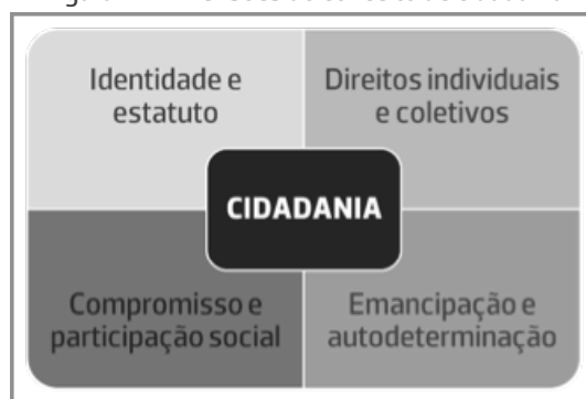
Figura 1 – Dimensões do conceito de cidadania

Nesse sentido, perspetiva-se a cidadania como uma construção social que integra quatro dimensões distintas: