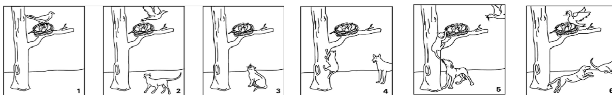
Figura 1. Imagens com os eventos que constituem a “História do Gato” de Hickmann (1982): (1) o pássaro está no ninho, (2) o pássaro deixa o ninho e um gato aproxima-se, (3) o gato observa o ninho, (4) o gato sobe à árvore e um cão aproxima-se, (5) o cão ataca o gato e o pássaro aproxima-se, (6) o gato foge perseguido pelo cão e o pássaro pousa no ninho.

As narrativas orais produzidas pelas crianças foram gravadas e transcritas usando as normas de transcrição de corpus oral adotadas pelo grupo Anagrama do Centro de Linguística da Universidade de Lisboa 2 . Posteriormente as narrativas foram classificadas por três juízes com base nos critérios do NSS (descritos adiante).